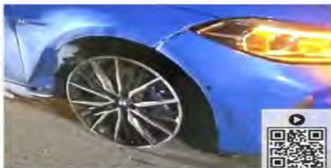
Los delincuentes lanzaron ponchallantas en la vía de cuota en Puebla.