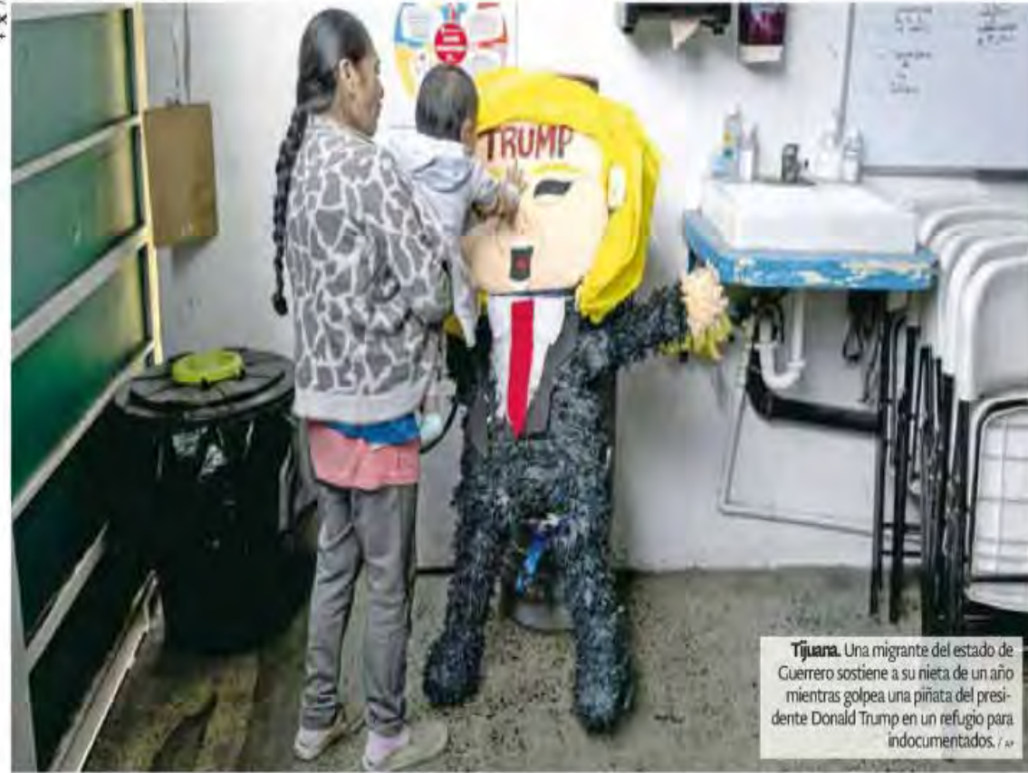
Tijuana. Una migrante del estado de Guerrero sostiene a su nieta de un año mientras golpea una piñata del presidente Donald Trump en un refugio para indocumentados.

El delantero mexicano se lució con doblete en la Champions League. / Pág.15