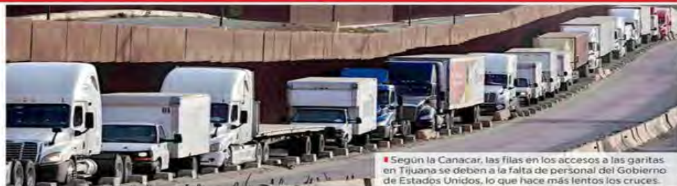
Según la Canacar, las filas en los accesos a las garitas en Tijuana se deben a la falta de personal del Gobierno de Estados Unidos, lo que hace más lentos los cruces.

Quieren a 10 mil militares en franja con México