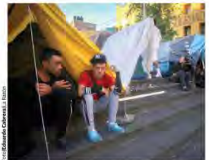
MIGRANTES en Plaza de la Soledad, en el Centro, ayer.

SE ORGANIZAN en Los Ángeles, NY, Chicago, Phoenix...; arman patrullajes para alertarse de posibles redadas; otros tienen miedo y no quieren salir.