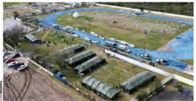
REFUGIO temporal que FA y municipales construyen para migrantes en Matamoros.

NOROÑA admite que hay pendientes más de 60 reformas a leyes secundarias de tipo migratorio; Monreal se dice abierto a que se revise el presupuesto y leyes de respuesta a Donald Trump. págs. 9 y 10