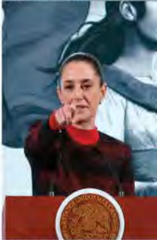
LA PRESIDENTA en conferencia, ayer.