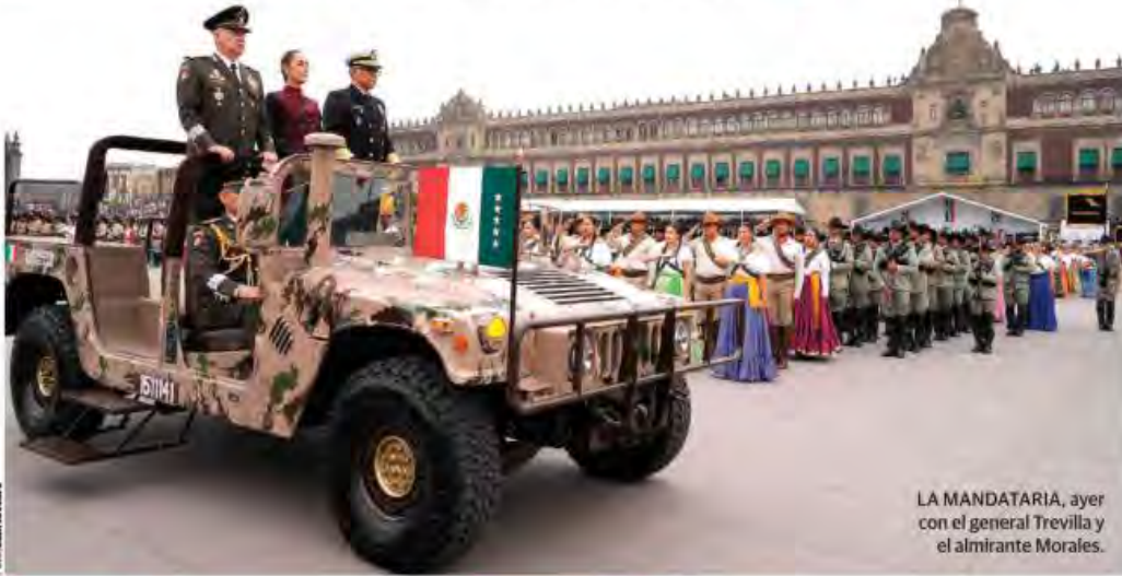
LA MANDATARIA, ayer con el general Trevilla y el almirante Morales.

SHEINBAUM destaca en el 114 aniversario del inicio de la Revolución las transformaciones; asegura que México es visto con admiración en el mundo; destaca apoyo de Fuerzas Armadas en seguridad y obras; éstas refrendan lealtad a la Presidenta y a la nación; cientos de familias aplauden a contingentes. pág. 12