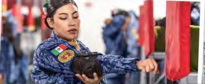
JORNADA DE EMOCIONES. Desde temprano, elementos del Ejército partieron hacia el Zócalo para el Desfile de la Revolución mexicana, el primero de la presidenta Sheinbaum MEXICO P. 5

JUEVES 21 DE NOVIEMBRE DE 2024 AÑO XIV N° 3316 | CDMX