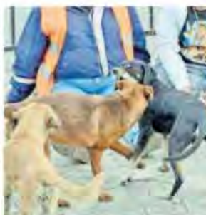
ACORPIO LA PRENSA

Inician alcaldías Miguel Hidalgo y Álvaro Obregón el Operativo Conjunto 'Prevención del Delito'