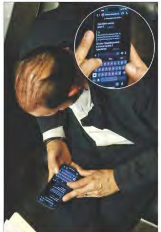
▲ El panista Marko Cortés fue captado ayer durante la sesión en el Senado ofreciendo una casa a un potencial comprador. En tanto, en la mañanera,