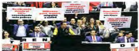
La Oposición reprochó al titular de Hacienda, los recortes en Salud y Educación.

En cuanto a la inversión, confió en que será potenciada por proyectos con la iniciativa privada y la relocali-