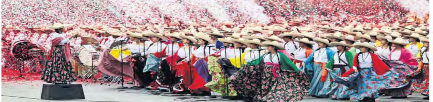
IMAGEN DEL DIA