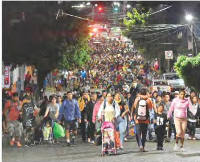
▲ Un nuevo contingente de alrededor de mil 500 extranjeros partió ayer desde Tapachula hacia el centro y norte de México. Buscan llegar a Estados