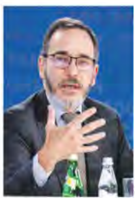
Gourinchas. "Hay una creciente incertidumbre en la economía mundial".

El FMI rebajó su proyección del crecimiento mundial para el próximo año y advirtió de una aceleración de riesgos, que van desde las guerras hasta el proteccionismo comercial. En la actualización de sus perspectivas de la economía mundial que publicó ayer, el organismo recortó una décima su estimación del PIB global para 2025 a 3.2 por ciento respecto a julio. Mientras que la proyección para este año la mantuvo en 3.2 por ciento. El estimado de crecimiento para México observó el mayor recorte entre las principales economías, tanto para 2024, de 2.2 a 1.5 por ciento, como para 2025, de 1.6 a 1.3 por ciento. —F. Gazcón / Bloomberg / PÁG. 4