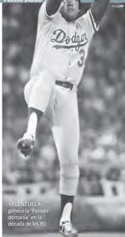
VALENZUELA generó la "Fernandomanía" en la década de los 80.

ERA RESPONSABLE de tomar territorios de otros grupos para el Cártel de Sinaloa.