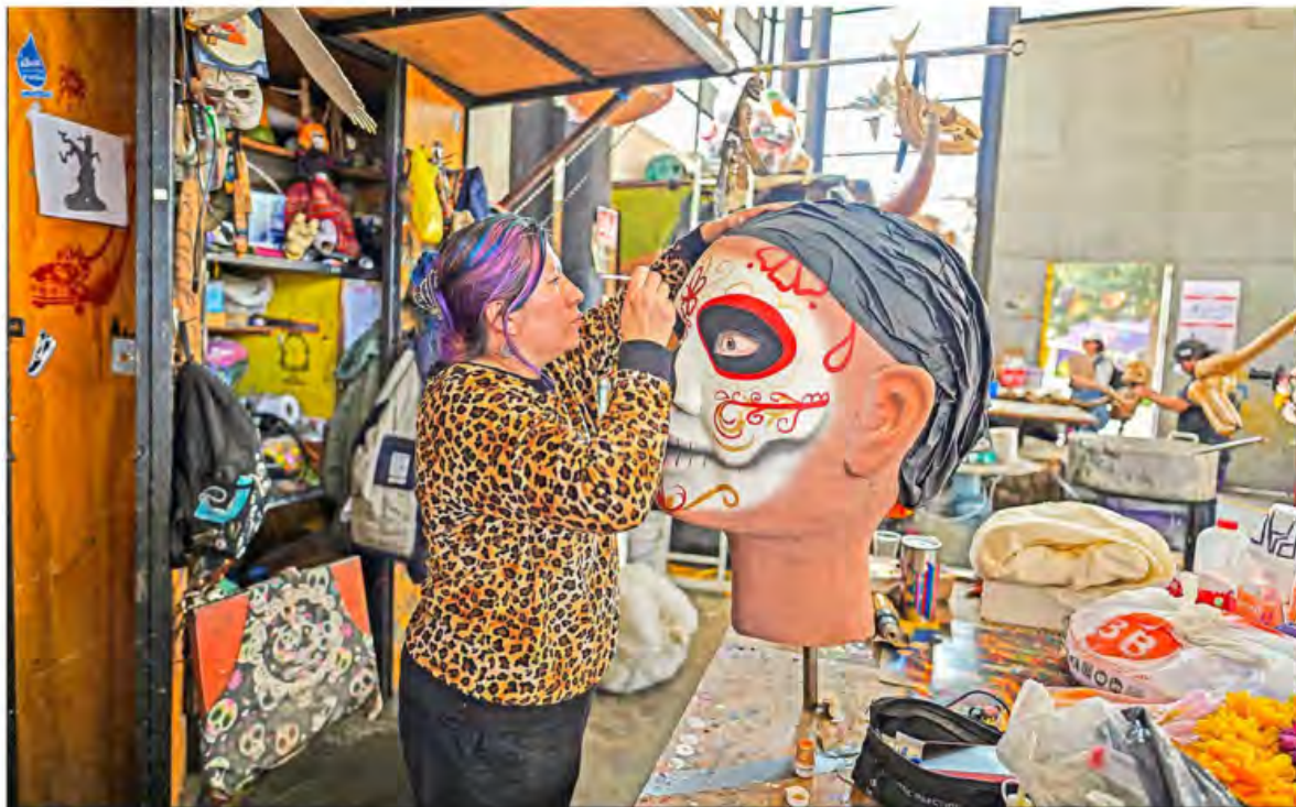
MONUMENTALES. En el Faro de Oriente, artesanos ya trabajan en la confección de calaveras de cartonería y papel maché a gran escala, que serán protagonistas en el tradicional Desfile de Día de Muertos en la Ciudad de México del próximo 2 de noviembre.