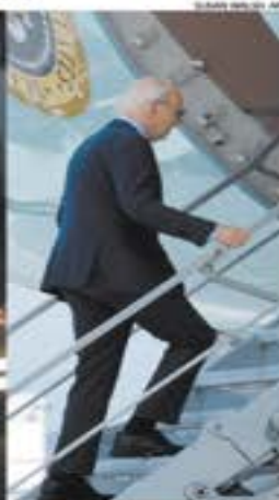
Por un lado, un Donald Trump fortalecido en la convención republicana; por el otro, el presidente Joe Biden, quien resultó contagiado por Covid-19.