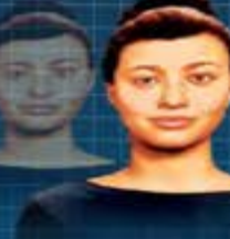
Ilustración: Jesús Sánchez

MIA es una asistente de inteligencia artificial creada por Mastercard que, en menos de un año, asesorará a pymes y a emprendedores. DINERO