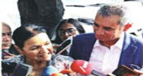
Sauri y Ochoa estuvieron ayer en el Tribunal Electoral.