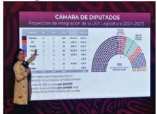
La secretaria de Gobernación señaló que la proyección de la LXVI Legislatura, con mayoría calificada en San Lázaro, se basa en los procedimientos seguidos en elecciones pasadas. La oposición criticó los comentarios y señaló que Segob no es la instancia para determinar la composición del Congreso. PÁG 7