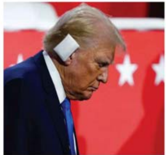
Aparición de Trump en la Convención; este jueves lanza su "mensaje histórico", según su propio dicho, para aceptar la candidatura republicana. PÁG 18