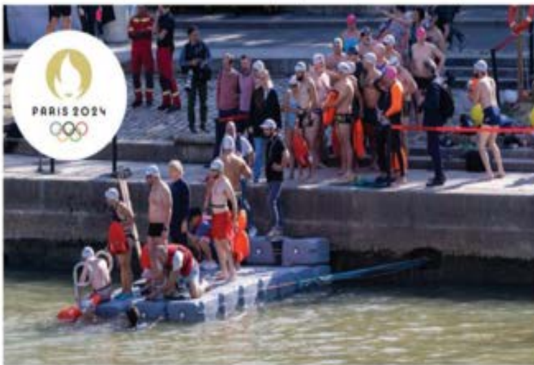
Encabezados por la alcaldesa de París, Anne Hidalgo, un grupo de parisinos se lanzó al Río Sena para mostrar que sus aguas están efectivamente saneadas. Mil 400 millones de euros se inyectaron a la recuperación del río. PÁG 19