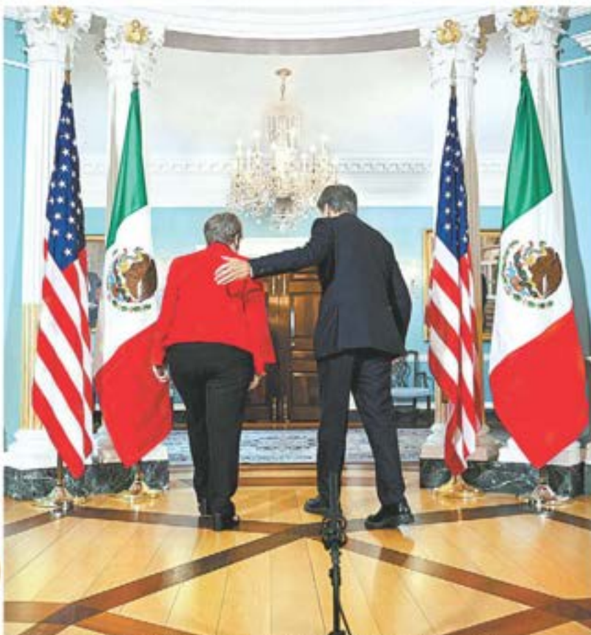
Reunión de la canciller y el secretario de Estado en Washington.