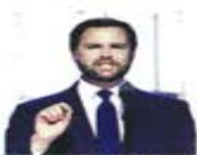
J.D. Vance, candidato a la Vicepresidencia de EU.