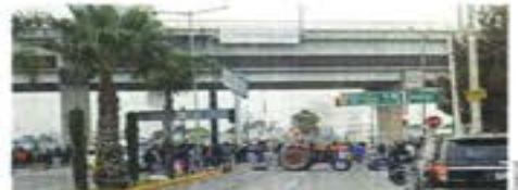
Durante 11 horas se afectó el principal acceso al AIFA.

El transporte público, de combis y camioneros, también fue desviado.