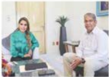
LA GOBERNADORA del estado y el Fiscal general, durante la reunión, ayer.

ADVIERTEN en UNAM desafíos que pondrán en riesgo supervivencia; alta vulnerabilidad en zonas agrícolas; peligro de desplazamiento de personas. pág. 8