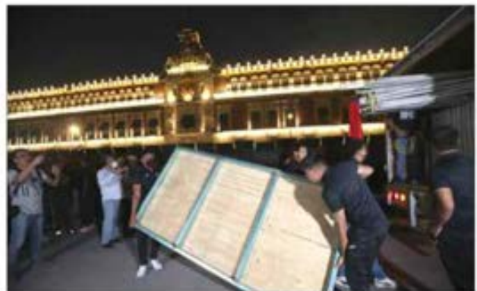
Anoche, los familiares montaron el campamento.

E. OLIVARES, A. URRUTIA, J. LAURELES, C. GÓMEZ Y S. OCAMPO / P 9