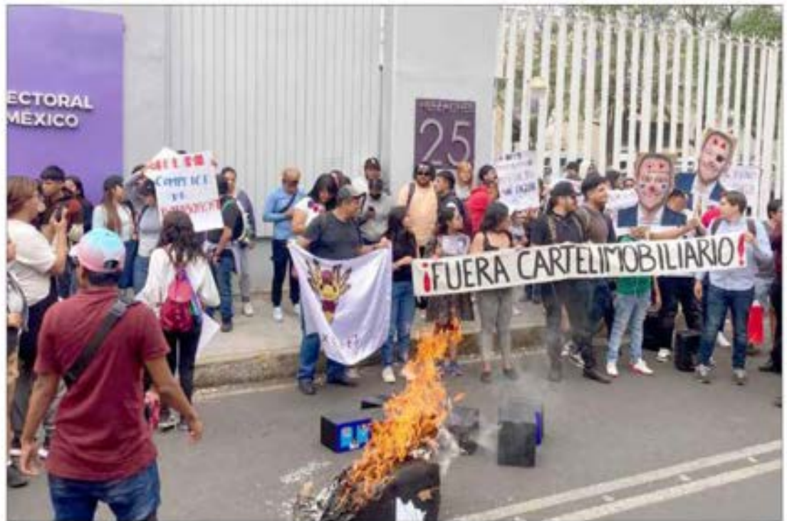
A. Universitarios se manifestaron frente al Instituto Electoral de la Ciudad de México contra la decisión de la Comisión de Quejas del organismo que —a partir de un recurso promovido por el PAN— impuso medidas cautelares que impiden a Morena vincular al aspirante a jefe de Gobierno y ex alcalde de Benito Juárez, Santiago Taboada, con el cártel inmobiliario. Foto e información de Ángel Bolaños / P 28