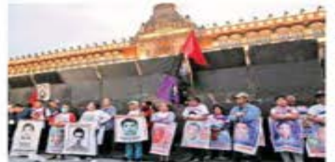
Los padres de los 43 marcharon en la CDMX y luego instalaron un plató en afuera de Palacio Nacional, cuyo exterior fue amarrado.