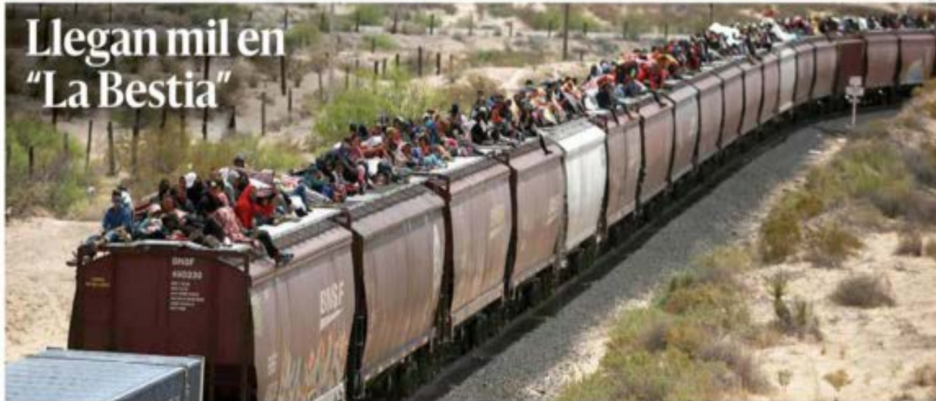
Un millar de migrantes, que esta semana llegó en el tren conocido como 'La Bestia', a Ciudad Juárez, Chihuahua, deambula a lo largo de 10 kilómetros del río Bravo —que hace frontera entre Juárez y El Paso, Texas— con la esperanza de pasar hacia Estados Unidos. PAE7