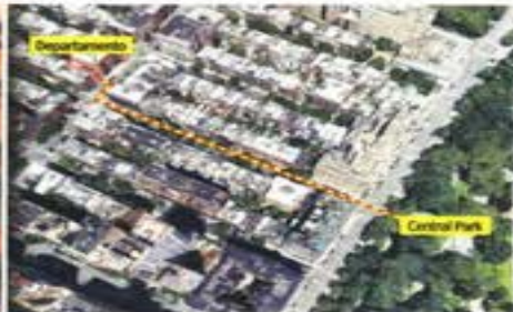
Ahora se acusa que Nahle dispone de un departamento en Nueva York, a unos metros de Central Park.

Acusa empresario que inmueble vale 46.7 mdp, y que no coincide con ingreso