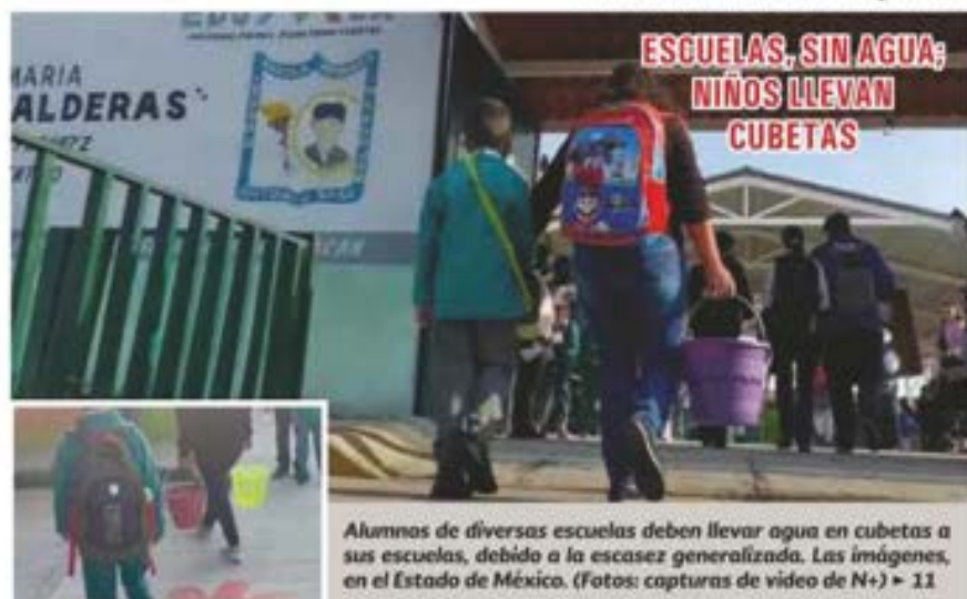
Alumnos de diversas escuelas deben llevar agua en cubetas a sus escuelas, debido a la escasez generalizada. Las imágenes, en el Estado de México. ▶ 11

RUMBO AL 2º DEBATE: ALTAS EXPECTATIVAS, POCOS RESULTADOS Y TENDENCIAS SIGUEN SIN MOVERSE