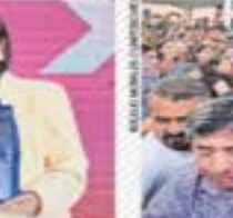
RECIBEN A MÁYNEZ EN LA UAM ENTRE RECHIFLAS Y APLAUSOS [ A4 ]