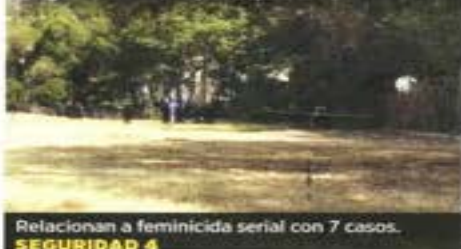
Relacionan a feminicida serial con 7 casos. SEGURIDAD 4