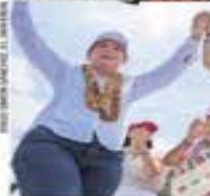
SHEINBAUM: OPOSICIÓN NO SUBE EN ENCUESTAS NI CON "ROYAL" [ A4 ]