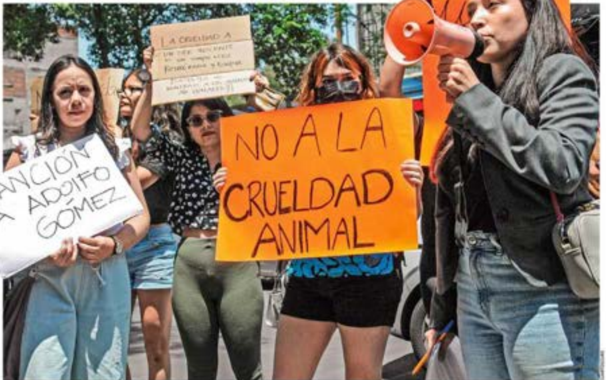
PROTESTAN POR SACRIFICIO. Activistas a favor de la vida animal acudieron a las inmediaciones del Senado de la República para manifestarse, luego de que el pasado miércoles se degolló una gallina en honor a Tláloc en las instalaciones de la Cámara alta.