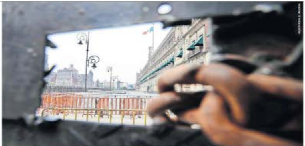
Vallas metálicas rodean el Palacio Nacional, ante la marcha de hoy y el plantón que anunciarán los padres de los normalistas desaparecidos.