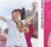
XÓCHITL: TRIBUNAL ELECTORAL NO QUIERE AMONESTAR A AMLO [ A4 ]