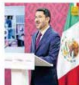
COMPTON/AG. CONTRA LA VIOLENCIA CONTRA LAS MUJERES

Clausuran la Convención Bancaria con la participación del presidente y candidatas