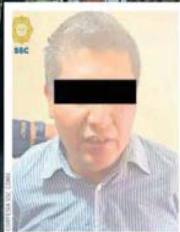
COMPTON/AG. CONTRA LA VIOLENCIA CONTRA LAS MUJERES