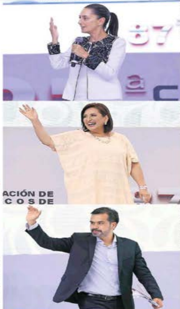
Claudia Sheinbaum, Xóchitl Gálvez y Jorge Álvarez Máynez participaron en la Convención Bancaria, en la que se acusaron, revivieron críticas y expusieron sus planes económicos.