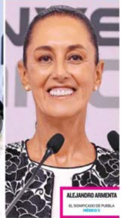
ALEJANDRO ARMENTA EL SIGNIFICADO DE PUEBLA MÉXICO 3