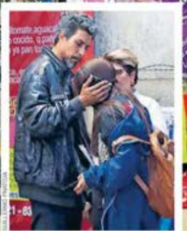
COMPTON/AG. CONTRA LA VIOLENCIA CONTRA LAS MUJERES