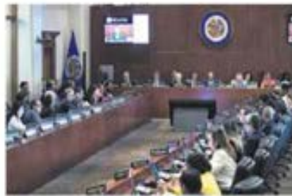
Resolución. Ecuador votó en contra y El Salvador se abstuvo.