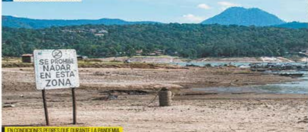
EN CONDICIONES PEDRES QUE DURANTE LA PANDEMIA