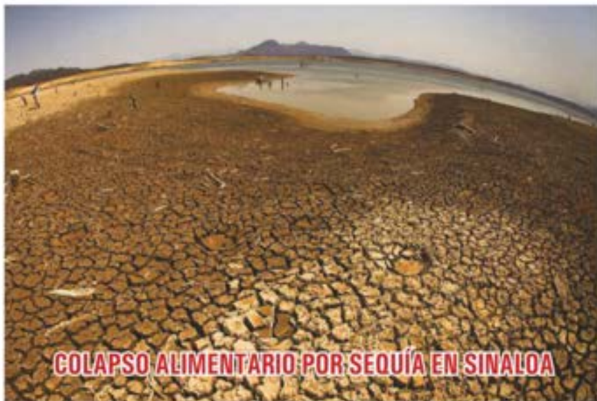
COLAPSO ALIMENTARIO POR SEQUÍA EN SINALOA

La mayoría de los embalses de Sinaloa están en estado crítico, por lo que se perderán muchos cultivos. En la imagen, la presa Sanalón, que llegó a niveles alarmantes. ▶ 13