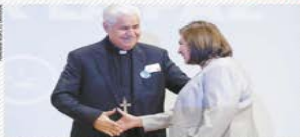
Gálvez propone desmilitarizar la administración pública | NACIÓN | A6