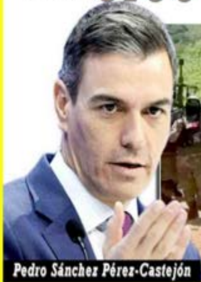
Pedro Sánchez Pérez-Castejón