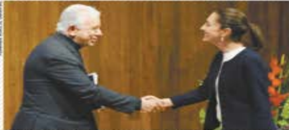
Schinbaum no coincide con el diagnóstico del Episcopado | NACIÓN | A4