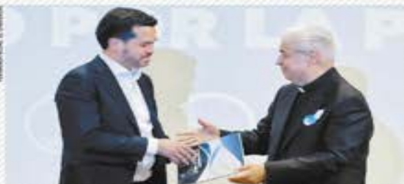
Máynez plantea financiar la pacificación con marihuana legal | NACIÓN | A4