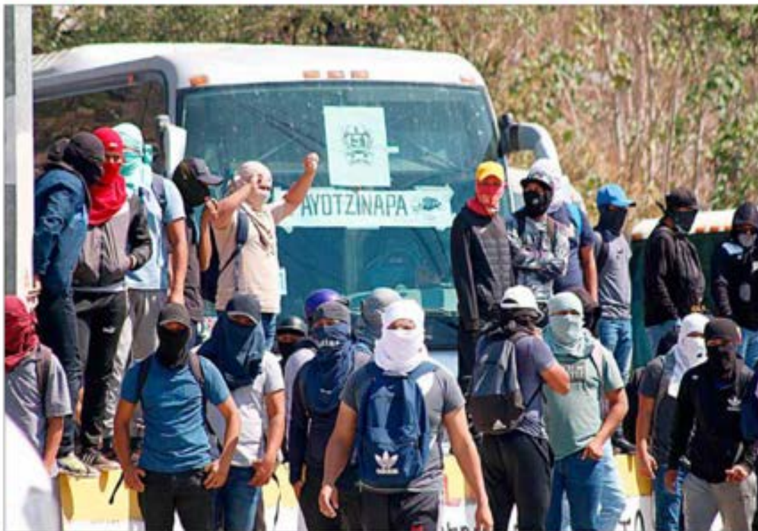
▲ Integrantes de la Federación de Estudiantes Campesinos Socialistas de México demandaron que se destituya a la gobernadora de Guerrero, Evelyn Salgado, así como a los secretarios de Seguridad Pública estatal, general Rolando Solano, y de Gobierno, Ludwig

Bloqueo de alumnos en la Autopista del Sol