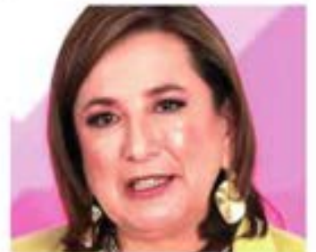
XÓCHITL NIEGA GUERRA SUCIA