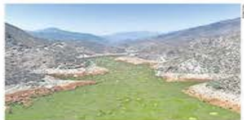
La presa El Realito se encuentra con 1.8% de capacidad.