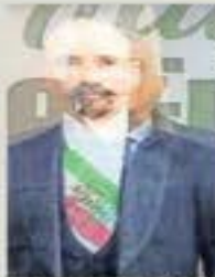
En la transmisión oficial del homenaje a Morelos, López Obrador "se trasladó" en el marco de la democracia.

Dijo que no fue error al dar a conocer el número telefónico, que lo volverá a hacer cuando esté de por medio la dignidad del Presidente y "el así preocupado que cambie su teléfono". Alberto Morales