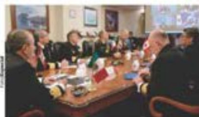
EL ALMIRANTE Rafael Ojeda, ayer en la reunión.

REALIZAN ministros de Defensa de la región quinta reunión; buscan incrementar capacidad de colaboración ante amenazas comunes: ciberdefensa, desastres... pág. 7