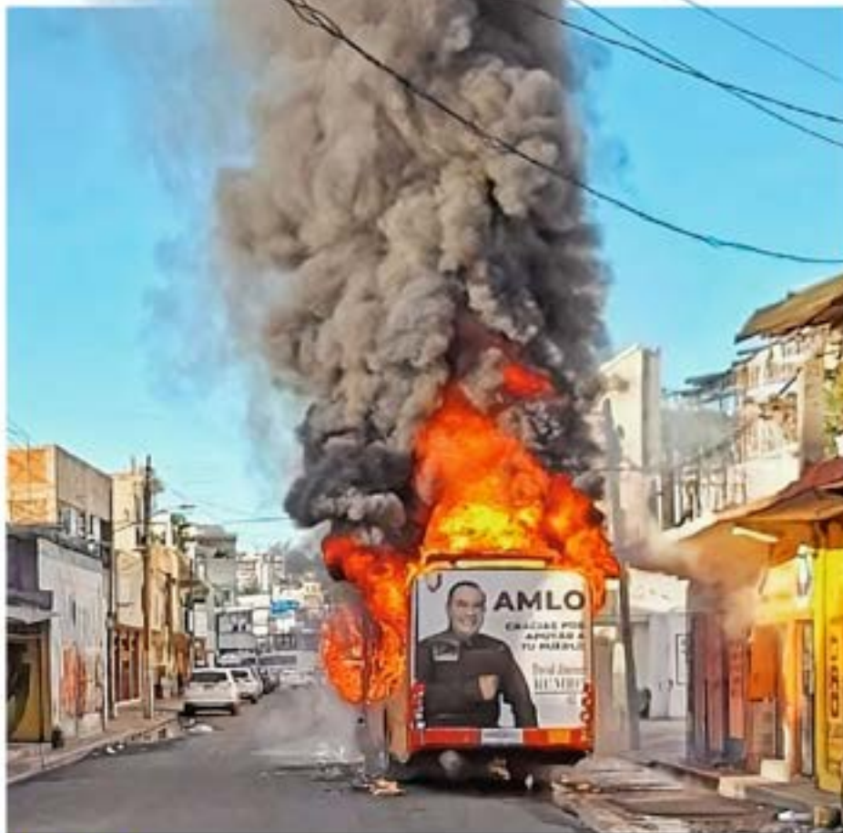
INFLAMAS. Un autobús fue incendiado ayer en Acapulco, Guerrero, versiones apuntan a violencia, pero la Fiscalía lo atribuyó a una falla eléctrica; En Tierra Caliente reportan al menos 17 muertos tras enfrentamiento ESTADOS P. 10

En el arranque del año se ha registrado un asesinato al día de uniformados, en promedio; la mayoría en Guanajuato, Edomex y Jalisco, de acuerdo con los reportes de la organización Causa en Común. Los días más violentos para este sector fueron el 7 y 8 de febrero, cuando al menos ocho policías fueron víctimas de homicidios y ataques en cuatro estados, entre ellos Guerrero, ubicado también entre las entidades con mayor número de crímenes en general, sólo en enero se registraron 145 casos, según datos oficiales ESTADOS P. 10