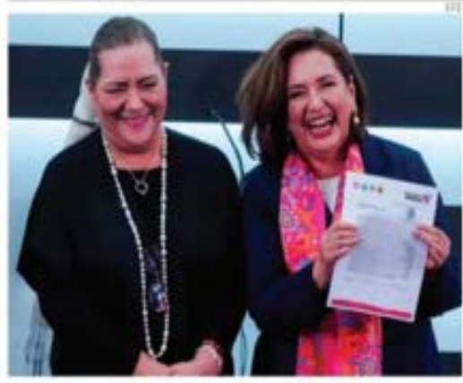
Guadalupe Taddel, presidenta del INE, entregó el registro a Xóchitl Gálvez.

nen grupos criminales para movilizar a la gente, y con esa base se dan el lujo de pactar treguas para frenar enfrentamientos entre ellos, como es el caso entre 'Los Tlacos' y 'Los Ardillos'. PÁG 6