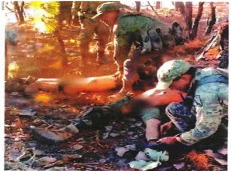
Videos de la matanza que circulan en redes sociales muestran cómo miembros de Los Tlacos apilan los cadáveres que presentan el tiro de gracia, se burlan, los quitan las botas y les prenden fuego.