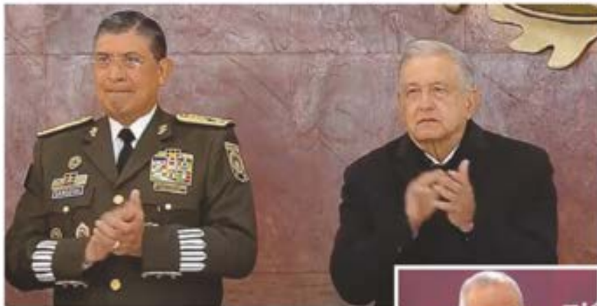
El presidente López Obrador, al encabezar el Día del Ejército, ayer en Puebla. Lo acompaña el General Secretario Luis Crescencio Sandoval, titular de Sedena. En el recuadro, el General Celestino Ávila Astudillo, Comandante del Ejército Mexicano, al hablar en nombre de la institución armada. ▶ 9

Por Miguel Badillo / Oficio de papel ▶ 12 y 13