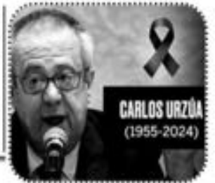
CARLOS URZÚA (1955-2024)