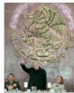
El presidente Andrés Manuel López Obrador encabezó la ceremonia del Día del Ejército en Oriental, Puebla.