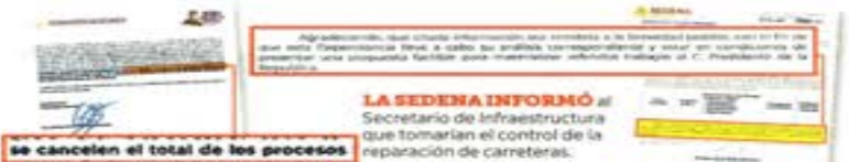
Se cancelan el total de los procesos

Por su parte, el director de Conservación de Carreteras, Guillermo Hernández, informó el pasado 6 de febre-