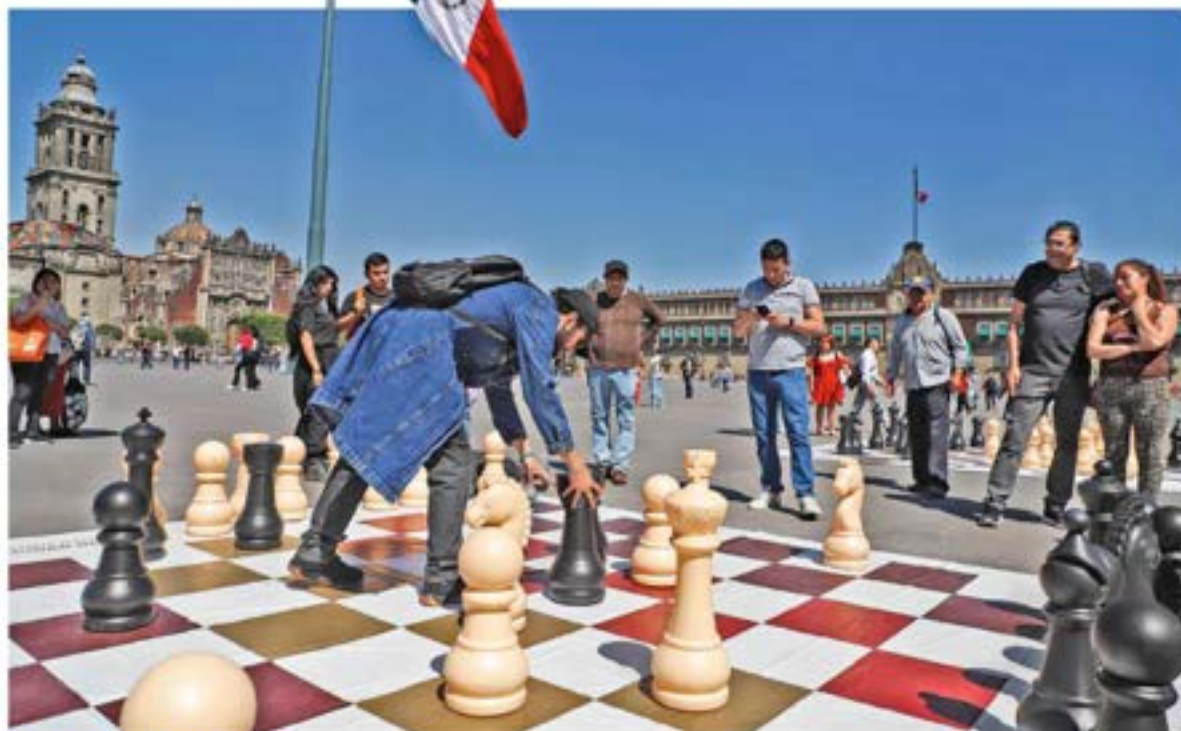
DEMOCRACIA Y ESTRATEGIA. Bajo una ondeante bandera que estuvo ausente el día de la marcha, los ciudadanos volvieron a apropiarse ayer del Zócalo capitalino, pero ahora lúdicamente para jugar ajedrez, actividad disponible desde que es peatonal. CDMX P. 8

MÉXICO DEBE FRENAR DISPUTA POR ACERO: KENNETH SMITH NEGOCIOS P. 17