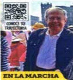
EN LA MARCHA