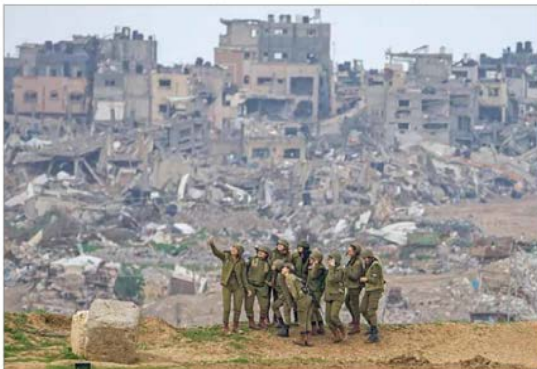
▲ Mujeres militares israelíes se toman una selfie con las ruinas de la franja de Gaza a sus espaldas. Las fuerzas armadas de Tel Aviv informaron que ayer atacaron Jan Yunis, donde han enfocado su guerra