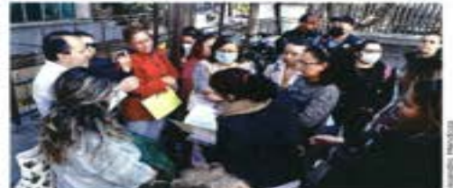
Los vecinos pidieron inspecciones detalladas en sus casas.

"Nos dieron información después de los sismos del 12 y 14 de diciembre de que, al menos, son 30 inmuebles los que se encuentran con riesgo alto y medio y que algunos de ellos tuvimos que ser desalojados", dijo Jimena, quien dejó su vivienda.