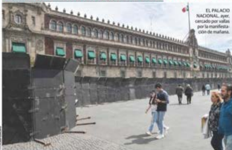
EL PALACIO NACIONAL, ayer, cercado por vallas por la manifestación de mañana.

BUSCAN organizadores que regresen corruptos al poder: Presidente; señala Delgado que Córdova quiere poner en duda comicios.