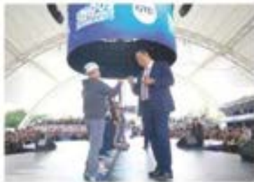
EL GOBERNADOR de Guanajuato en su 6° informe, ayer.

ENSU 6° informe, el gobernador de Guanajuato señala que siempre hubo soluciones ante adversidades como la financiera o sanitaria. pág. 10