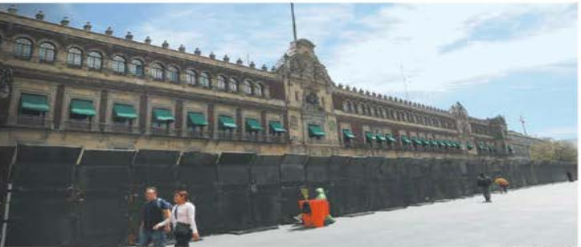
ALDO MARTÍNEZ / EL UNIVERSAL