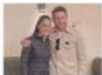
LA CANDIDATA Y EL CAMPEÓN La presidenta Claudia Sheinbaum con el líder del Partido Acción Nacional. Pág. 5