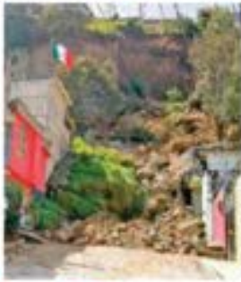
MEZQUITES DEL OLIMPICA E RANCHO

Super Bowl y el efecto Taylor bate récord: emisión de TV más vista en EU y México; hoy desfilan los Chiefs