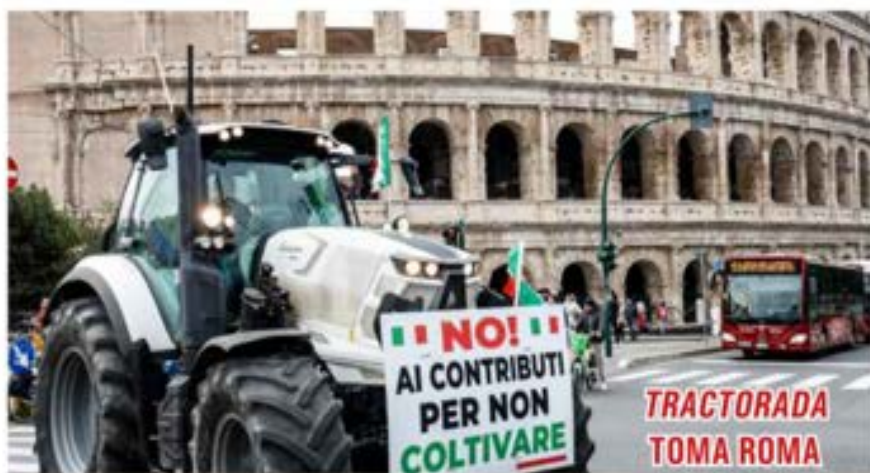
Miles de agricultores de Italia tomaron la ciudad de Roma para exigir freno al alza de impuestos y facilidades para comercializar sus productos. ▶ 20

Por Redacción/ El Independiente ▶ 10 - 13