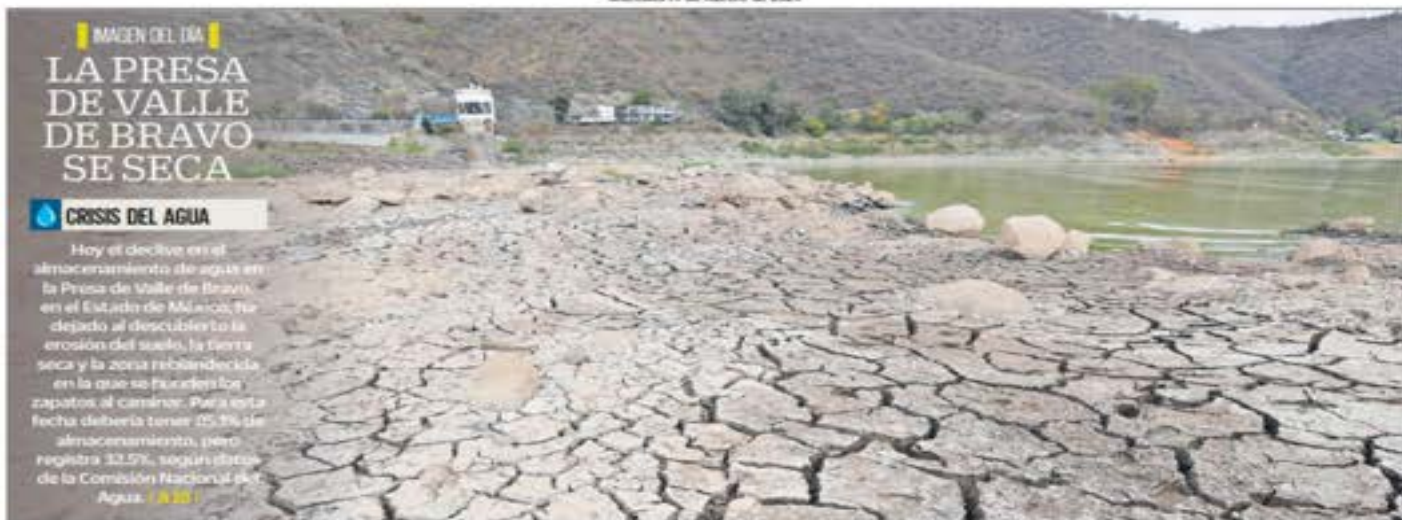
IMAGEN DEL DÍA LA PRESA DE VALLE DE BRAVO SE SECA