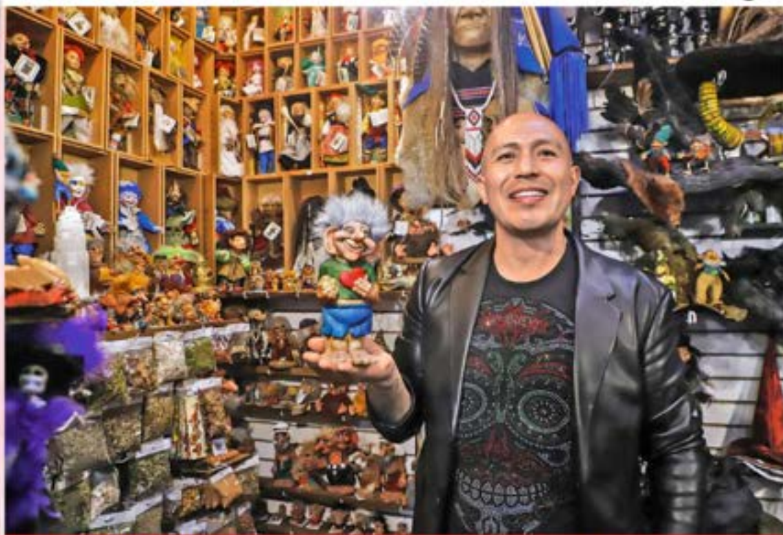
ENTRE RITUALES Y SUPERSTICIONES. En un rincón del Centro Histórico, las personas buscan con amarras y hasta con troles hacer que perdure su relación de pareja; el encargado de realizar los encantamientos también se vuelve un poco psicólogo CDMX P.7