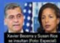
Xavier Becerra y Susan Rice se insultan

PLEITOS EN EL GABINETE DE BIDEN POR MIGRACIÓN, SE TACHAN DE: IMBÉCIL E IDIOTA