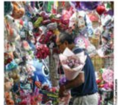
EN EL MERCADO de Jamaica cientos acuden por flores para regalar hoy en San Valentín.

SUFRE POR AMOR 89%; Y LAS FLORES... POR LAS NUBES