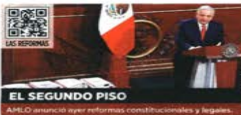
EL SEGUNDO PISO AMLO anunció ayer reformas constitucionales y legales.

Eso incluye a los adultos mayores de 65 años, la universalización para discapacitados, becas para estudiantes pobres de todos los niveles educativos, un año de salario a jóvenes aprendices, depósitos a jornaleros agrícolas, precios de garantía y entregas