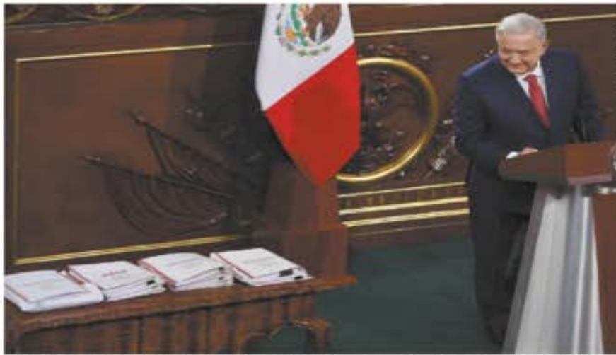
El presidente Andrés Manuel López Obrador observa las carpetas en las que plasmó sus 20 propuestas de reformas para acabar con la aprobada en los gobiernos neoliberales y que presentó ayer en el Hemiciclo Parlamentario ubicado en Palacio Nacional.