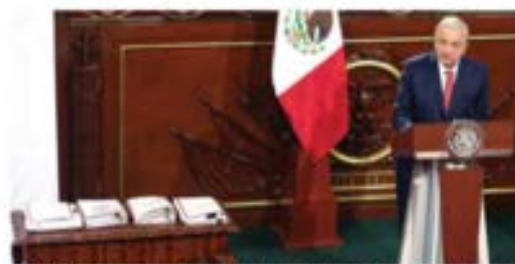
EL PRESIDENTE, ayer al presentar las iniciativas en Palacio Nacional.