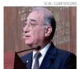
Ministro Alberto Pérez Dayán.

Pérez Dayán recordó que fue la precisamente la Constitución de 1917 la que dio a la Suprema Corte las facultades suficientes para invalidar cualquier acto que no la respete, independientemente de la fuente de la que provenga. PAG 8