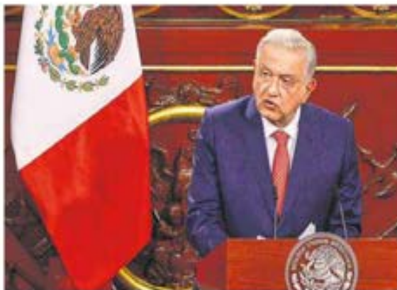
Oportunidad histórica. Los cambios son para revertir adulteraciones, dice