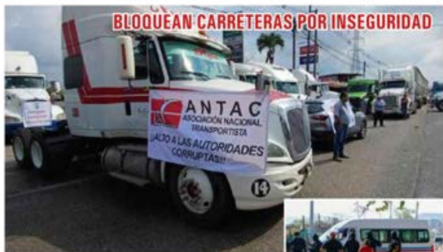
En gran parte del país transportistas cumplieron su advertencia y cerraron las principales carreteras por tanta violencia. A la derecha, cuatro choferes fueron asesinados en Guerrero. ▶ 23

Por José Vilchis Guerrero y Luis Carlos Silva ▶ 12 y 13