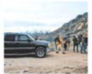
Servicio exclusivo. ESPECIAL

El candidato republicano llamó a su partido a rechazar el acuerdo de voto migratorio por ayuda para Ucrania. PÁG. 11