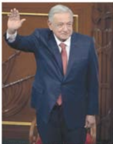
En el 47 aniversario de la Constitución de 1976, el presidente Andrés Bello... de la 41... regimen... del 47...

TRUMP PIDE RECHAZAR ACUERDO DE BIDEN P. 14