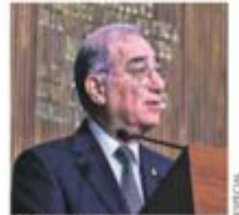
En Querétaro. Rechaza ministro propuesta de AMLO de reforma judicial

TRANSPORTISTAS CONVOCAN A OTRA MARCHA PARA EL 15 DE FEBRERO POR INSEGURIDAD, EXTORSIONES Y ABUSOS. PÁG. 18