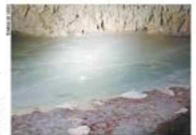
Activistas muestran el derrame de cemento que se ha filtrado y se expone en el acuífero.

Cancún. — Las obras en el Tramo 5 Sur del Tren Maya han provocado que ríos de cemento contaminen las cavernas subterráneas como Cerro de Jaguar, como documentó el naturalista Raúl Padilla. Expertos indicaron que esto ocurre también en otras cavernas y afecta el acuífero que corre por ellas y surge de agua a Quintana Roo. | ESTADOS | A12