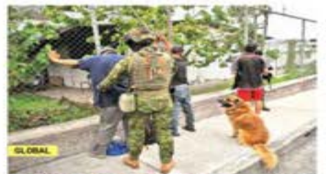
GLOBAL ECUADOR ALISTA REDACARCELES

Entre las zonas con mayor índice delictivo para el hurto de hidrocarburos, se encuentran Hidalgo, Veracruz, Guerrero, Estado de México, San Luis Potosí y Tamaulipas, entre otras entidades.