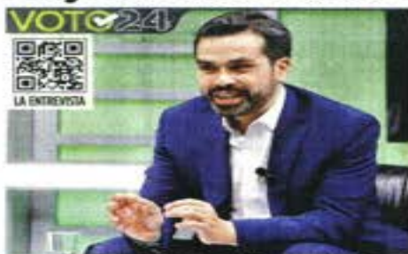
Jorge Álvarez Máynez aseguró que MC no ha resentido una fractura.

Un día después de haberse registrado como precandidato único del partido naranja, Álvarez Máynez aseguró que MC no ha resentido una fractura como consecuencia del severo cuestionamiento que hizo el Gobernador de