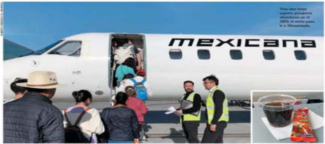
Tras una larga espera, pasajeros aguardaron en el APU del avión para ir a Zihuatanejo.