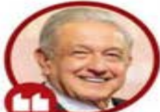
ANDRÉS MANUEL LÓPEZ OBRADOR PRESIDENTE DE MÉXICO

PRIMERA Asesinan a delegada de MC en Michoacán