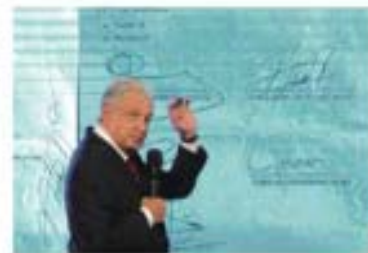
EL PRESIDENTE , ayer, al exhibir el acuerdo de la oposición en Coahuila.

En sesión del INE el guía exige sancionar pacto "ilegal e inmoral"; el Presidente exhibe documento "descarado y mafioso"; dirigente panista lo defiende y acusa: "El mafioso es usted" págs. 7 a 9