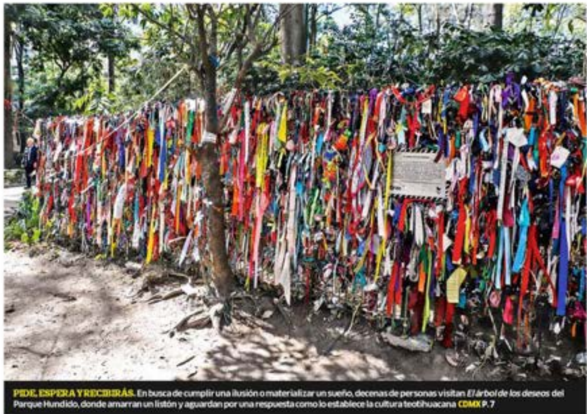
PIDE, ESPERA Y RECIBIRÁS. En busca de cumplir una ilusión o materializar un sueño, decenas de personas visitan El árbol de los deseos del Parque Hundido, donde amarran un listón y aguardan por una respuesta como lo establece la cultura teotihuacana CDMX P. 7

Los problemas generados por la depresión laboral pueden ser la antesala del suicidio, asegura el doctor Gerson Andueza; el Instituto para la Atención y Prevención de las Adicciones (IAPA) en la capital exhorta a la ciudadanía a identificar los síntomas del trastorno para prevenirlo a tiempo VIDA+ Y CDMX P. 18 Y 8