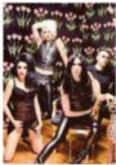
CONTRASTA ACT MEDIA

Rueda el balón en el Torneo de Clausura 2024; América estrena la corona ante Tijuana