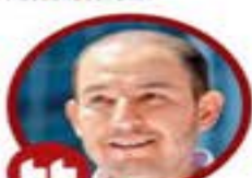
URSULA CORBERO SU CARRERA TOMA VUELO

PRIMERA Asesinan a delegada de MC en Michoacán