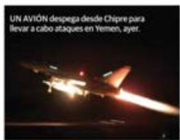
UN AVIÓN despegando desde Chipre para llevar a cabo ataques en Yemen, ayer.

DENUNCIA precandidata del Frente en INE; demanda que "deje de ser omiso"; la morenista rechaza financiamiento ilícito. págs. 10 y 11