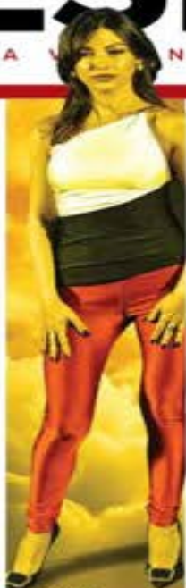
URSULA CORBERO SU CARRERA TOMA VUELO