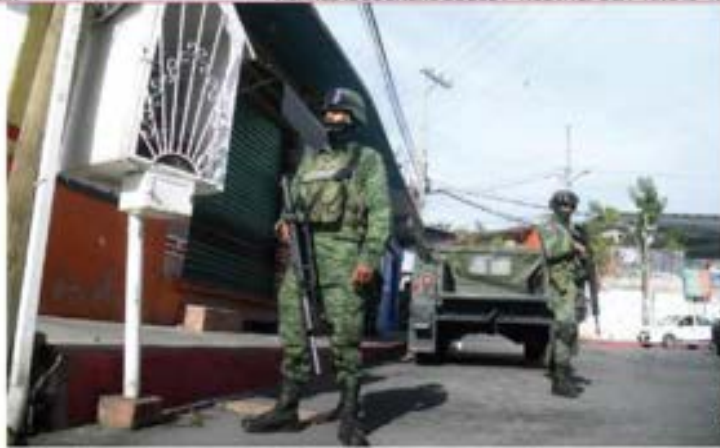
VIGILANCIA , ayer, de Fuerzas Federales en Cuernavaca tras homicidios.