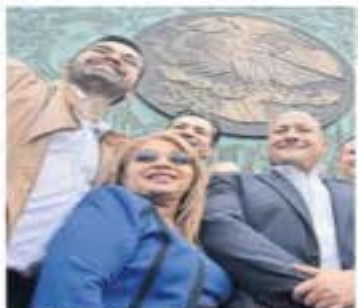
Jorge Álvarez Máynez y Enrique Alfaro, cuando en MC todo era miel sobre hojuelas.