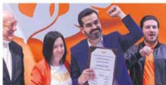
Precandidato naranja. Álvarez Máynez se niega a responderle al gobier jaliscoense.