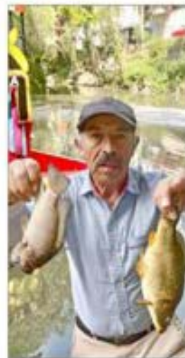
▲ Colono del pueblo de Nativitas, Xochimilco, muestra los peces muertos en el embarcadero de Zacapa por la contaminación de aguas negras.