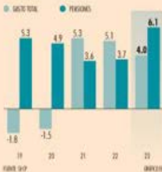
Gasto público total y gasto en pensiones | EN MIL DE MILLONES DE PESOS

• Ha acelerado ese rubro en los últimos años y por primera vez crecerá más que los ingresos, de acuerdo con datos de SHCP.