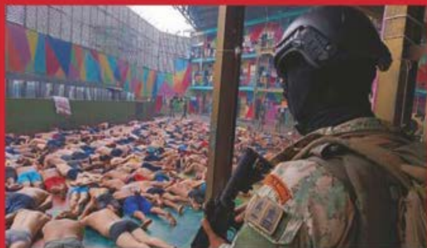
Las principales ciudades de Ecuador, como Guayaquil y Quito están bajo resguardo militar. En penales controlados, los reos fueron sometidos para evitar amotinamientos. Aún prevalece el caos en el país.

Por Redacción /El Independiente y EFE ▶ 16 y 17