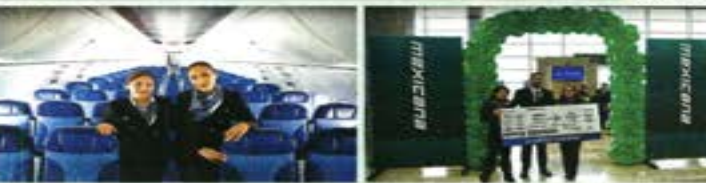
La tripulación de la nueva Mexicana de Aviación ayer en el AIFA.