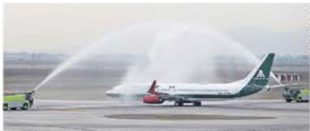
El avión Boeing 737-800 despegó del Aeropuerto Internacional Felipe Ángeles hacia Tulum.

403 AGENTES ASesINADOS en el país entre enero y la primera semana de diciembre de 2023.