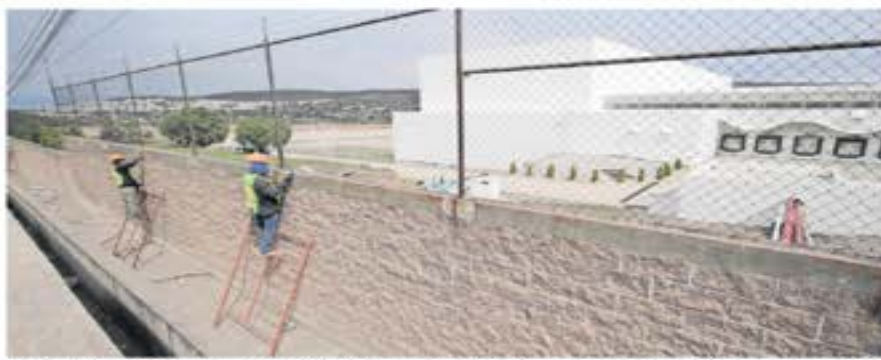
Los trabajos de acondicionamiento se han enfocado en la parte exterior. La fachada ya no tiene la cromática de la tienda departamental a la que perteneció la bodega y ahora está pintada de blanco.

EU ACABA 2023 SIN PACTO MIGRATORIO | MUNDO | A12