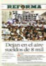
Dejan en el aire sueños de 8 mil