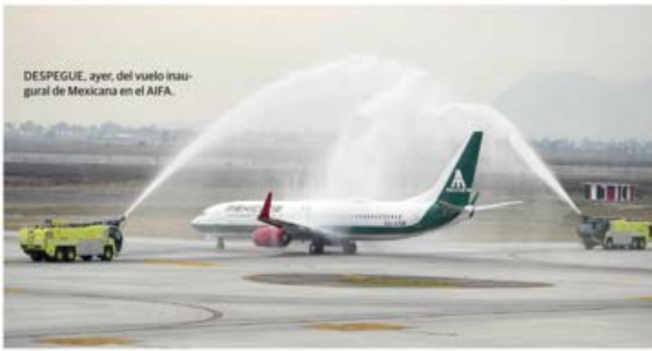
DESPEGUE, ayer, del vuelo inaugural de Mexicana en el AIFA.