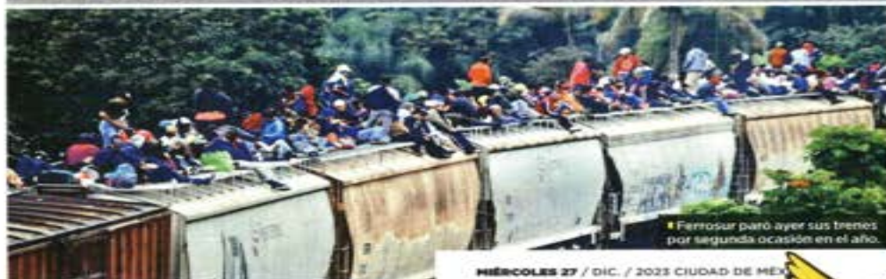
Ferrosur paró ayer sus trenes por segunda ocasión en el año.