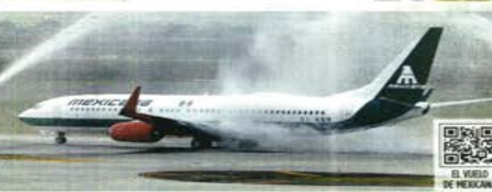
EL VUELO DE MEXICANA