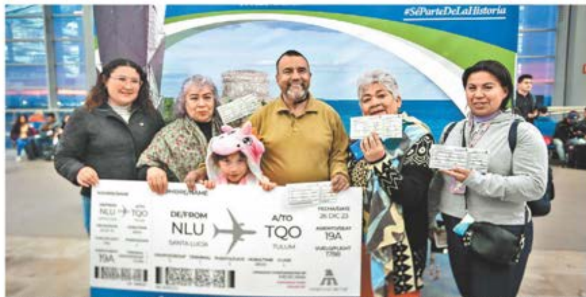
Familia mexicana previo al vuelo AIFA-Tulum en el Boeing 737-800 de la aerolínea administrada por el Ejército. ARACELI LÓPEZ