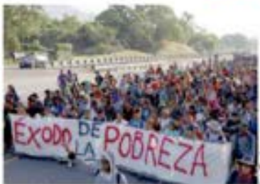
PASO de la caravana, ayer por Chiapas; calculan 6 mil indocumentados.

REANUDA caravana hoy su marcha desde Villa Comaltilán; enviados de alto nivel de Biden llegan hoy para acordar nuevas medidas ante alto flujo migratorio. pág. 9