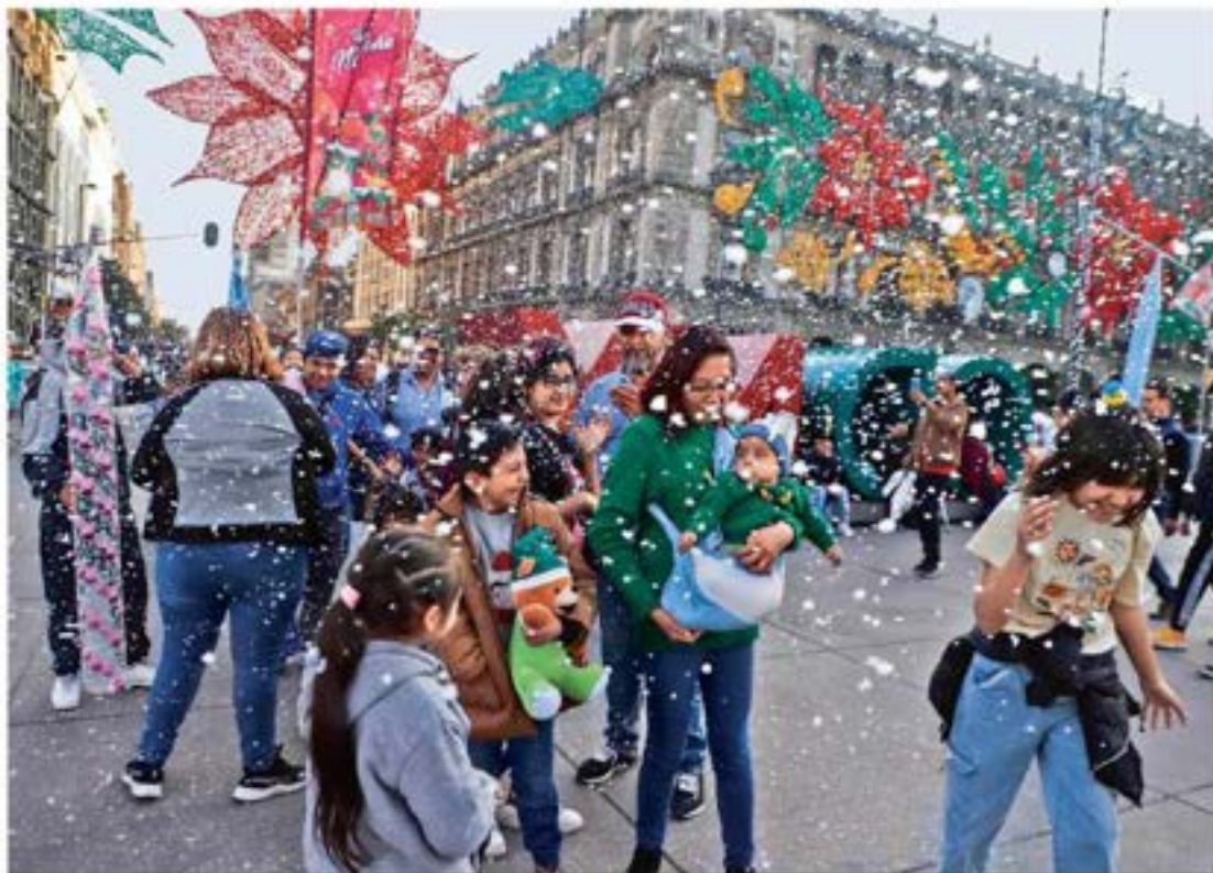
FELICIDAD EN FAMILIA. La verbena decembrina en el Zócalo capitalino inició este fin de semana, cientos de personas gozaron de los espectáculos gratuitos que se realizaron; la nieve artificial fue uno de los grandes atractivos.