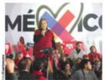
XÓCHITL GÁLVEZ, de gira en Veracruz.

SACUDE masacre perpetrada por grupo armado en Guanajuato; hay 11 heridos hospitalizados. pág. 11