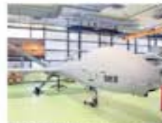
Los drones se usan en misiones de vigilancia y disuasión.

La Defensa Nacional cuenta con 20 drones entre los que