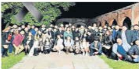
Las Veladas eran jóvenes que celebraban en San José del Carmen.

La Secretaría de Defensa Interior que ha gastado 64 millones 152 mil 208 pesos en la compra y mantenimiento de drones de 2016 a la fecha. | NACIÓN | A6