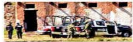
El ataque fue en la hacienda San José del Carmen, en Salcaména, Guanajuato. Los asistentes se tomaron una foto antes de la explosión.