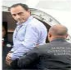
Borge, extraditado en 2018.

Con base en lo anterior, determinó que habían cambiado las condiciones obje-