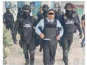
TRASLADO, agosto de 2023, de Uriel TV. Hoy está libre. Pág. 6