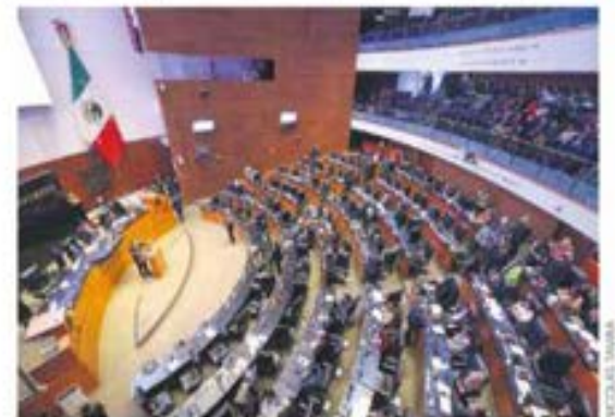
Sin acuerdos. Rechazan la segunda terna para sustituir a Arturo Zaldívar.

su voto al nombramiento de dos magistrados electorales que están pendientes. Tras el rechazo de la segunda terna, ahora —según la Constitución— el presidente deberá designar ministra a alguien de esta terna. —Eduardo Ortega / PÁG. 38