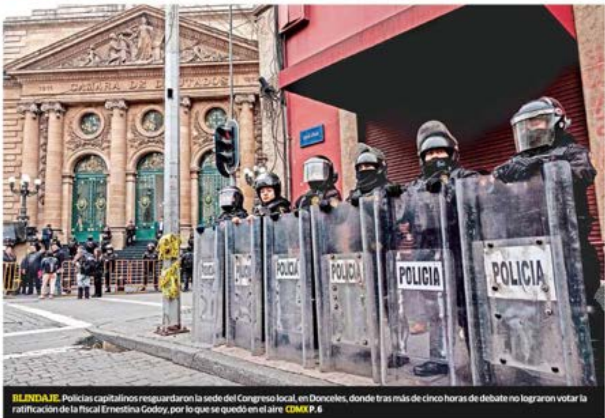
BLINDAJE. Policías capitalinos resguardaron la sede del Congreso local, en Donceles, donde tras más de cinco horas de debate no lograron votar la ratificación de la Fiscal Ernestina Godoy, por lo que se quedó en el aire CDMX P. 6