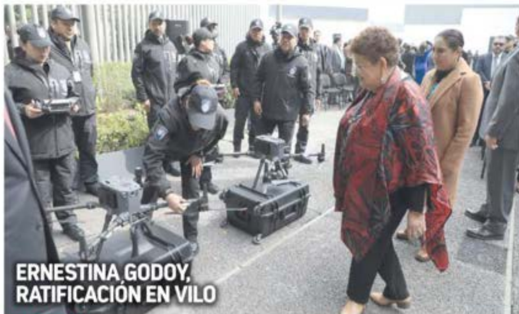
ERNESTINA GODOY, RATIFICACIÓN EN VILO

por ciento obtuvo la candidata del PAN-PRI, Xóchitl Gálvez.