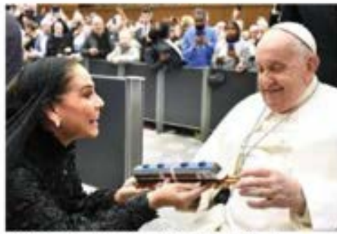
EL PAPA Francisco, con la gobernadora de Quintana Roo, ayer.

ENTREGA gobernadora de Q.Roo al Pontífice carta de AMLO y una réplica del ferrocarril que será inaugurado mañana; realiza gira en Italia para promover turismo en su entidad. pág. 10