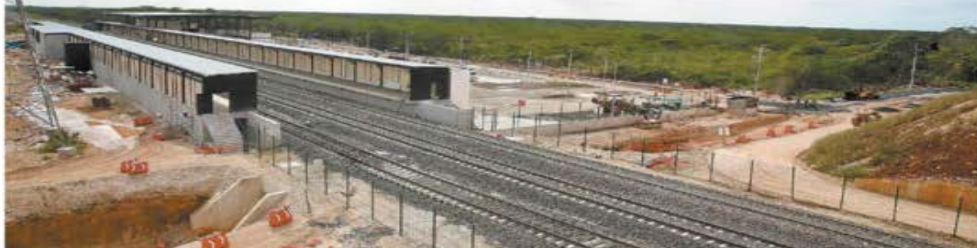
Políticos y activistas señalan que el presidente López Obrador sólo inaugurará las vías, porque estaciones, como la de Calixtlán, todavía no están terminadas.

hecho por EL UNIVERSAL, se constató que hay vías inconclusas y señalética faltante. En las estaciones y vías se carece de infraestructura peatonal, ciclista y de accesos, así como de instalaciones y escaleras eléctricas. | A4 Y A5 |