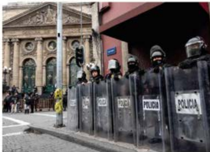
POLICÍA capitalina blindó ayer la Cámara de Diputados local.

Oradores de la 4T hacen tiempo para no llegar a la votación que sería adversa; PAN acusa "machincuepas"; retomarán discusión en periodo extra pág. 16