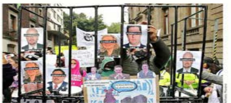
Afuera del Congreso de la CDMX llegaron grupos afines a la Fiscal Godoy para protestar contra los legisladores de Oposición.

Posponen hasta febrero decisión; cerraran opositores filas contra Morena EDUARDO CEBALLO Las intenciones de Morena por prolongar hasta 2028 el mandato de Ernestina Godoy en la Fiscalía de la CDMX chocaron con una corriente opositora. El partido oficial no logró aumentar su techo de 38 votos; necesitaba 44 para tener una mayoría calificada y mantener a Godoy en el cargo. La Oposición cerró filas e impidió la ratificación. Ante la imposibilidad de lograr su objetivo, Morena pospuso la decisión para principios del próximo año. Ayer, de una forma inusitada para una Legislatura caracterizada por el ausentismo, los 66 diputados locales estuvieron presentes y a tiempo para la sesión ordinaria, la penúltima del actual periodo. Después de que se presentó el dictamen ante el Pleno, comenzó la discusión, con los morenistas contrando su algarín alrededor de las acciones de Godoy contra peñistas implicados en la corrupción inmobiliaria en la Alcaldía Benito Juárez. La estrategia guisa era alargar el debate para tratar de ganar votos mientras que los opositores urgían a votar el nombramiento. "Que sepa la ciudadanía, (aquí) de frente a la ciudadanía que queda constancia que esta Oposición en la ciudad hoy los dobló, hoy quedaron de rodillas, no reanudar los votos", reclamó el panista Ricardo Rubio.