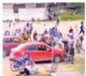
CAPTURAS DE VIDEOS

Controlados por el crimen seis municipios vecinos de Texcaltitlán; hay pavor de la población Pág. 6