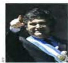
■ Milei asumió ayer la Presidencia argentina.

"Se ha identificado el consumo de melones de Melchita y Rudy como la fuente probable del brote", informó la PHAC.