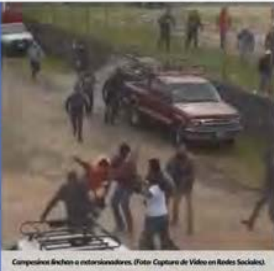
Compañeros ñeñen a extorsionadores.