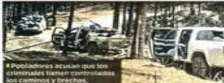
■ Pobladores acusan que los criminales tienen controlados los caminos y brechas.