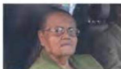
MUERE LA MAMÁ de El Chapo. Pág. 3

Diffundirla "ocasionaría afectación a la esfera personal" de Graue, argumenta dicho Comité. Pág. 4