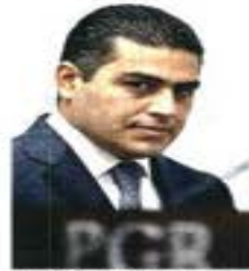
En 2016, García Harfuch encabezó la Agencia de Investigación Criminal.

El software Pegasus fue adquirido por la AIC, de la