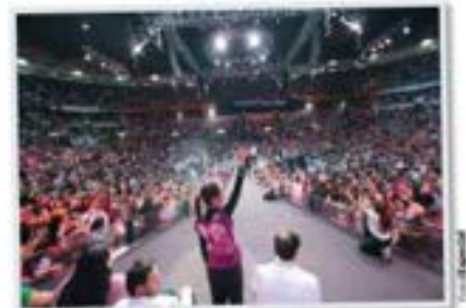
CLAUDIA Sheinbaum, ayer en la Arena México.

A 16 DÍAS del paso de Otis, autoridades buscan bajo deslave a una familia en la Nueva Era, ayer.