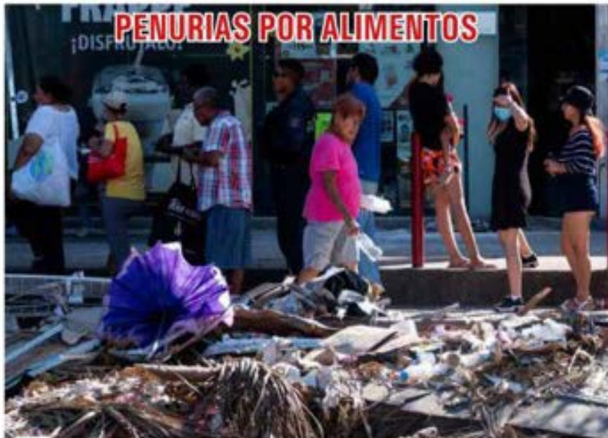
Mientras el gobierno anunció el fin de la emergencia en Acapulco, decenas de personas sufren todo tipo de penurias para recibir desparasas o adquirir alimentos, en calles fétidas con grandes cantidades de basura.