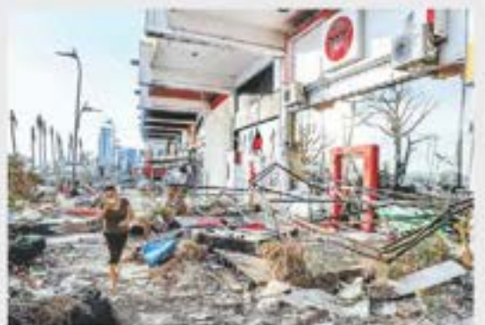
El gobierno declaró fin de la emergencia.