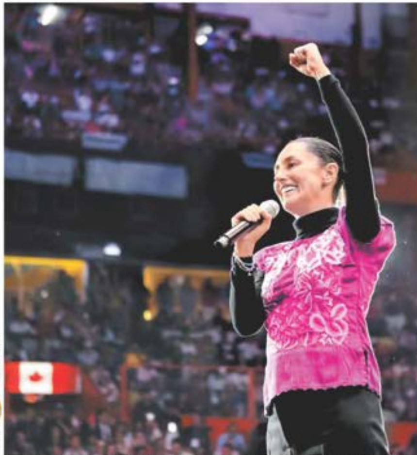
La aspirante presidencial pidió a los competidores cerrar filas por la transformación. ESPECIAL