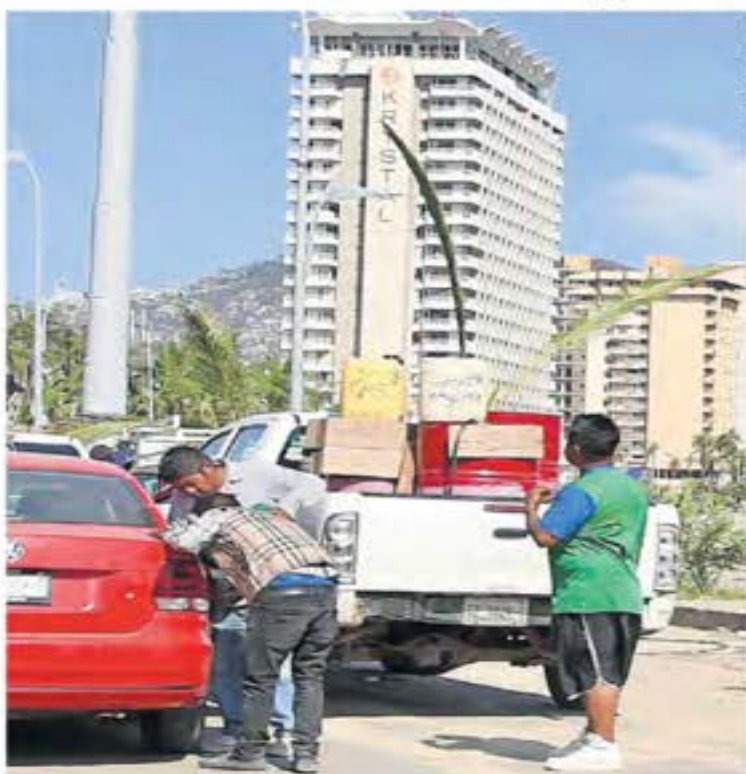
Sobre la Costera Miguel Alemán se ofrece a autoservidistas combustible robado de los gasolineros.

La escasez que dejó el paso del huracán Otis dispara los precios de los productos básicos