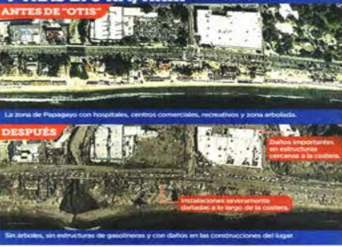
ANTES DE "OTIS"