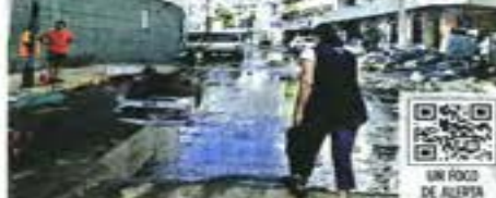
En las calles de Acapulco aún se observa basura, en medio de agua estancada.

Acapulqueños tienen en puerta una crisis de enfermedades como dengue, infecciones respiratorias agudas, leptospirosis, problemas gastrointestinales y hasta la posibilidad de un brote de cólera, debido a la basura, polvo, animales muertos, albecos sin drenar y hedor a una semana del impacto del huracán "Otis", advirtieron especialistas en salud. "Y hay muchos casos de enfermedades de diarrea, infecciones en los ojos y se prevé que venga una situación de dengue", dijo un médico de las carteras de Salud que instaló el Gobierno federal en distintos puntos del puerto. En un recorrido por calles del Centro, zona Costera y periferia de Acapulco se observan todavía toneladas