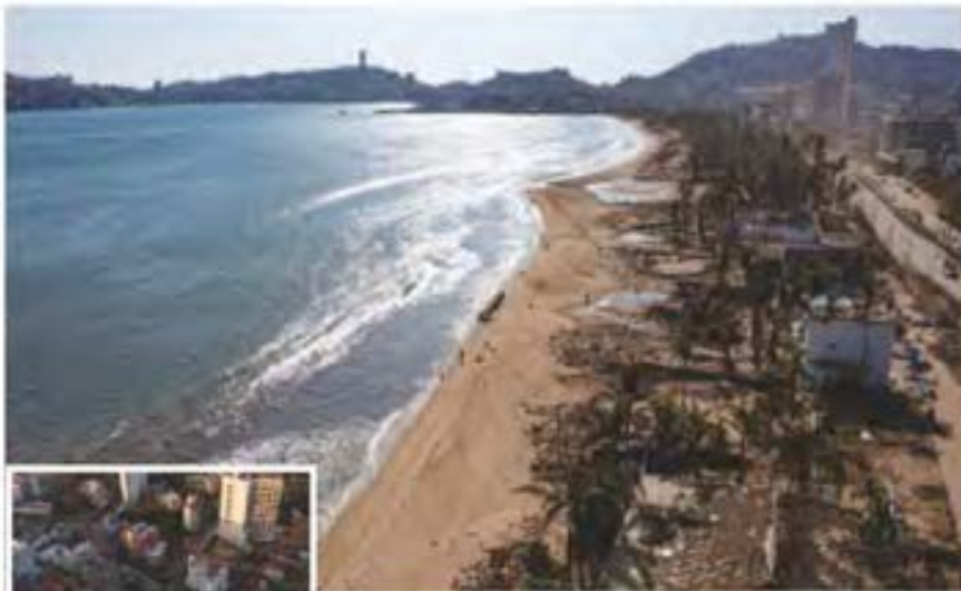
Cerca de 30 mil negocios turísticos, como restaurantes, hoteles, clubes de playa y bares fueron destruidos en la costera Miguel Alemán. La mayoría no reabrirá.