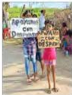
Dañificados piden apoyo en la vía de Acapulco a Pinotepa Nacional.