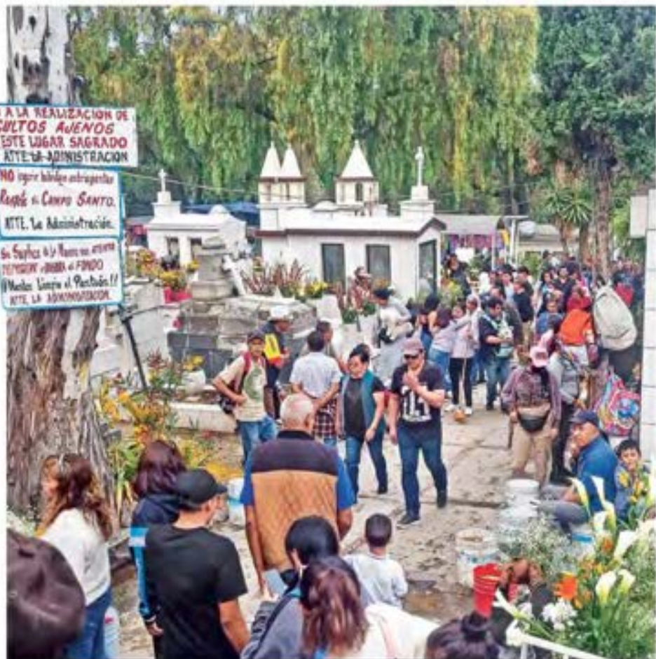
HOMENAJE. Como cada 2 de noviembre, miles de personas acudieron a los panteones para visitar a sus difuntos, limpiar sus tumbas o nichos y hacer un memorial con flores de colores; en la imagen el de Peñón de los Baños.

Si cualquier tipo de fiesta se celebra DEBE haber un FONDO (Mantenimiento al Panteón!!) ATE: LA ADMINISTRACIÓN.