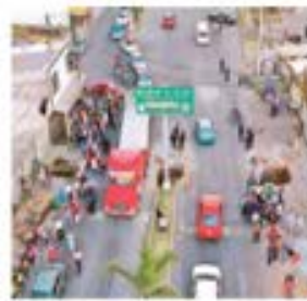
CRISTINA MARIELA GUTIÉRREZ

En su primer año de impartir justicia laboral, el Poder Judicial de CDMX dictó 230 sentencias y trabajó en 10 mil 717 asuntos