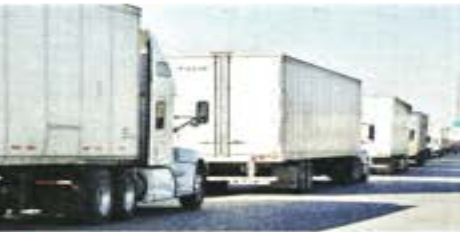
Aunque se reabrió la garita comercial en Cd. Juárez-El Paso, la saturación de camiones de carga continúa en el resto de los cruces.

ASEDIA ISRAEL A GAZA: AMENAZA HAMAS CON MATAR A REHENES INTER. (PÁG. 15)