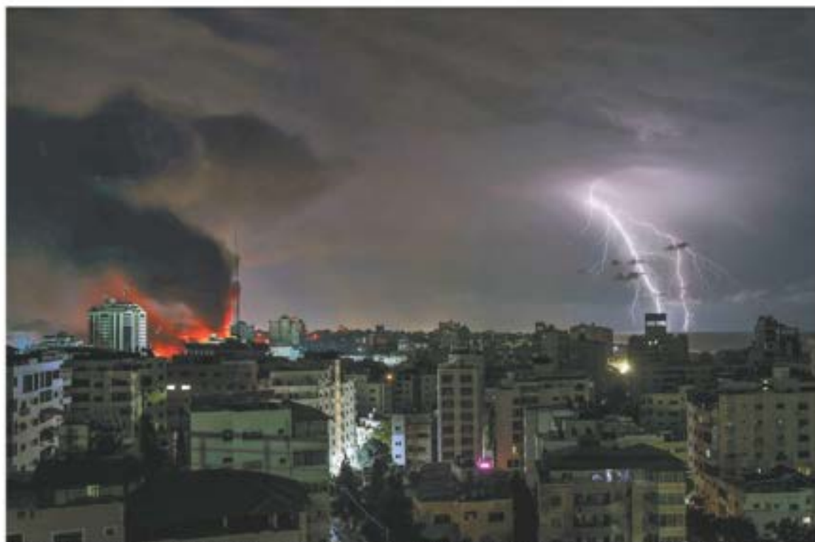
El gobierno israelí ha alistado a más de 300 mil reservistas con miras a una operación militar por tierra.

Repudia ataque a civiles Exige Sheinbaum que la ONU "se ponga a trabajar" ROSE ANTONIO BELMONT - PÁG. 9