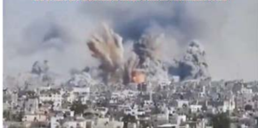
Mientras se agravan las confrontaciones entre Hamas y el ejército israelí, el grupo terrorista libanés Hez-bolláh amenazó con atacar las posiciones estadounidenses en Medio Oriente si interviene directamente en el conflicto a favor de Tel Aviv. ▶ 19