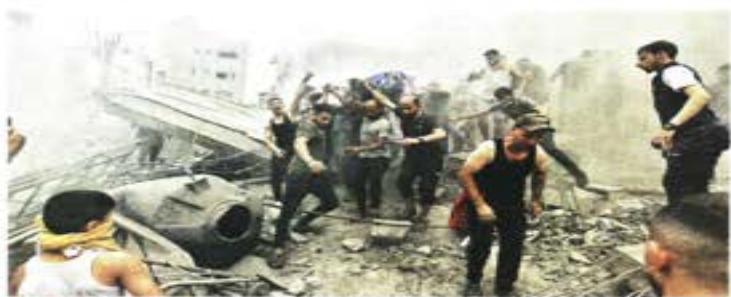
EN GUERRA. En represalia por el ataque de Hamas contra civiles, el ejército israelí ha bombardeado más de mil objetivos en Gaza.

Por la tarde, la Embajada de Israel en México en un reclamo inusual demandó a López Obrador condenar la barbarie de Hamas y rechazar frontalmente los actos terroristas de esa organización. "Lamentamos profundamente que el Gobierno de México no haya adoptado una postura más enérgica y decidida ante esta situación. La comunidad internacional tiene la responsabilidad de actuar de manera contin-