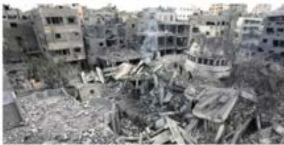
PALESTINOS revisan escombros de una mezquita destruida por Israel.

BATALLAN mexicanos para salir de Tel Aviv; 8 ya lo lograron, gimnastas, en vías de hacerlo; nayaritas, en vilo.