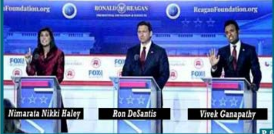
Nimarata Nikki Haley