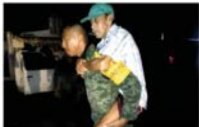
EJERCITO aplica desde ayer el Plan DNIII.