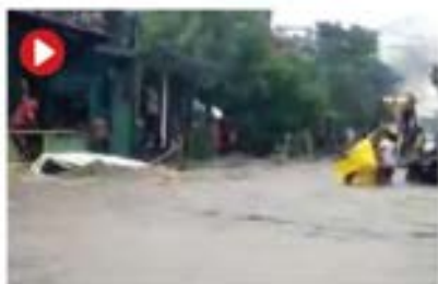
MAX arrastra vehículos en Petatlán.