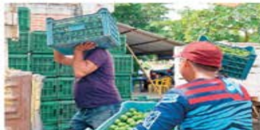
Pese a los operativos de autoridades federales y estatales en Apatzingín, criminales siguen cobrando cuota a productores y empacadores de limón.

Apatzingín, Mich.— Los limoneros en el Valle de Apatzingín no sólo continúan con el pago de extorsiones, sino que para recuperar su producción se han apuntado a las nuevas “cuotas” impuestas por los grupos