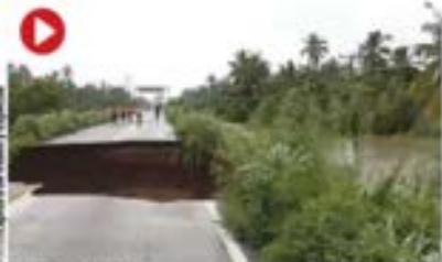
COLAPSO de la carretera Acapulco-Zihuatanejo, ayer.