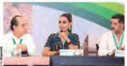
LA GOBERNADORA de Guerrero, ayer.