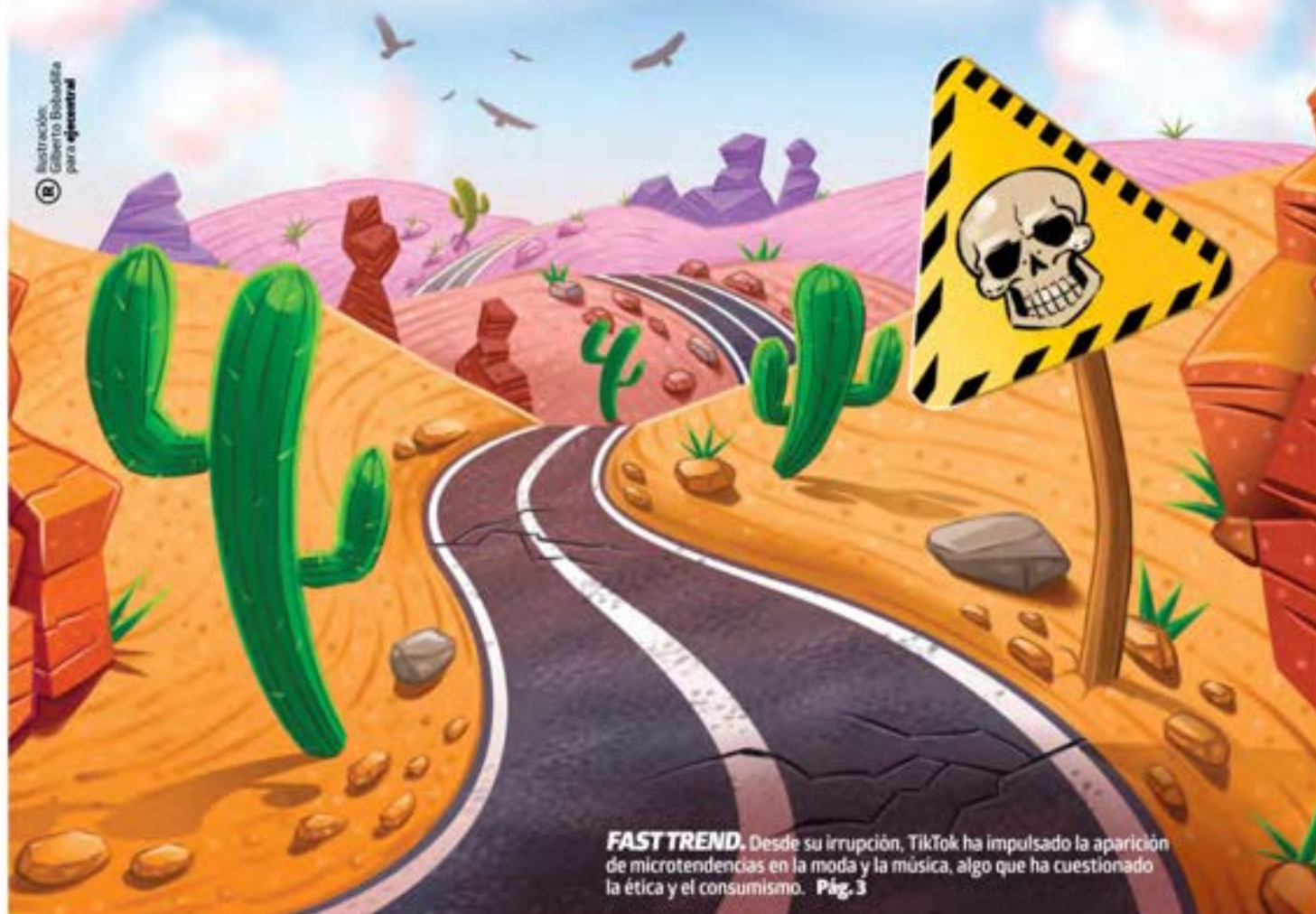
Ilustración: Gilberto Bobadilla para eje@entral

FAST TREND. Desde su irrupción, TikTok ha impulsado la aparición de microtendencias en la moda y la música, algo que ha cuestionado la ética y el consumismo. Pág. 3