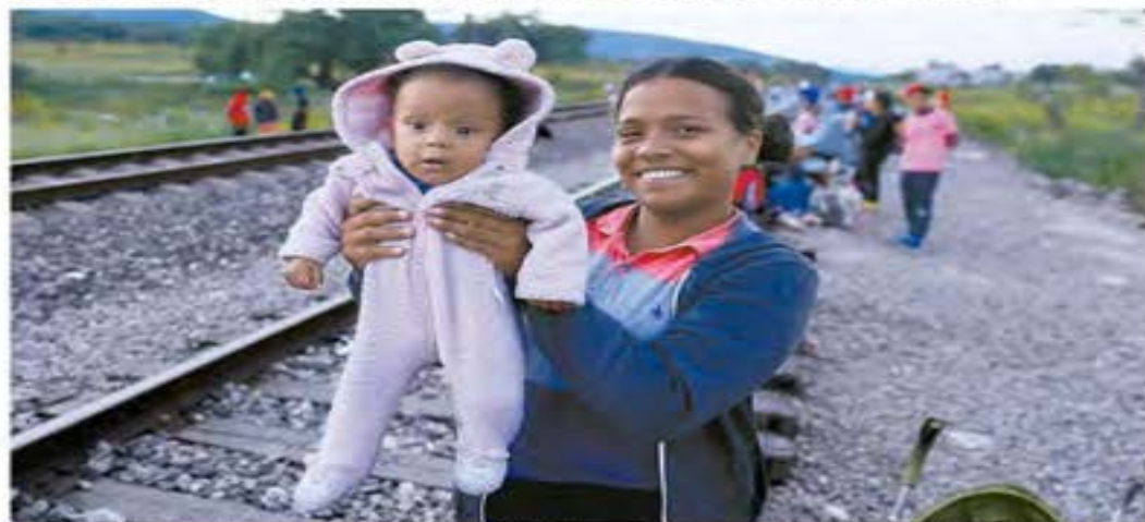
Entre los municipios de Ixtapalapa y Toluca, en el Estado de México, cientos de migrantes, con todo y bebés, buscan salir a La Bordo.

Acusan que algunos policías capitalinos les venden el plástico en mil dólares, cuando éste cuesta 15 pesos; autoridades dicen que no se han presentado denuncias