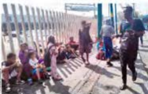
GRUPOS de indocumentados, ayer, afuera de la Central del Norte.

En 2022 detenciones fueron 2.3 millones; en éste ya van 2.2 millones; SRE reconoce que ni el vecino del norte ni México pueden procesar creciente flujo