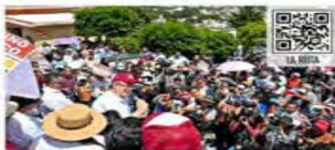
El ex Cónsul Marcelo Ebrard reunió ayer a cientos de simpatizantes en Tlaxcala.