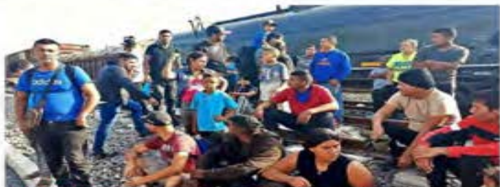
VARADOS EN NL. En su ruta para llegar a EU, miles de migrantes permanecen en Nuevo León, ya que los trenes no han reactivado sus recorridos a Piedras Negras.

El despliegue de elementos militares para contener la ola migrante rompió récord, pero no se traduce en resultados. Ancorado como el antidoto al flujo de migrantes desde el sur hasta el norte del País, el despliegue castrense supera los 34 mil efectivos conforme el "Plan de Migración en la Frontera Norte y Sur", de acuerdo con cifras oficiales del Gabinete de Seguridad. Este nivel se mantiene desde el mes pasado, a raíz del aumento de los flujos migratorios, y representa un récord en lo que va del sesenio, ya que el máximo alcanzado era de 32 mil elementos en octubre de 2022. Pero la expansión de migrantes se da no sólo en la frontera sur sino en estadas del centro y norte del País. Ayer, el Instituto Nacional de Migración junto con ejecutivos de Ferromex y la Gobernadora de Chihuahua, Maru Campos, adoptaron medidas ante la emergencia y el desborde migratorio. Se decidió bajar a migrantes que viajan en trenes y regresarlos en aviones y autobuses hacia el sur de México. Sin embargo, no especificaron cómo harán para tener los vehículos que retornen a migrantes ni dónde serán ubicados. El Puente Internacional de Ciudad Juárez, Chihuahua, es uno de los más colapsados por la crisis. El Gobierno federal se comprometió a realizar gestiones con Venezuela, Brasil,