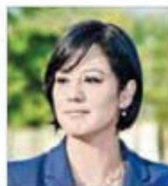
▲ Es la más joven de los aspirantes.