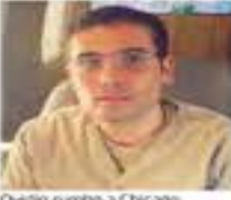
Ovidio rumbo a Chicago.