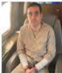
Ovidio Guzmán ya está recluido en un penal de Chicago. Este lunes tendrá su primera audiencia.

"Esta acción es el paso más reciente en el esfuerzo del Departamento de Justicia para