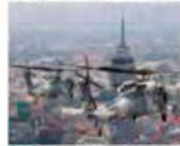
Helicópteros del Ejército captados en el tradicional Desfile Cívico Militar, ayer sobre la CDMX. PÁG 6

López Obrador resalta misión de Fuerzas Armadas en tareas de seguridad pública