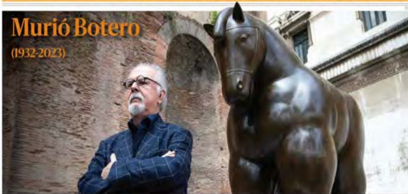
El arte está de luto por la muerte del pintor y escultor colombiano Fernando Botero, cuyas figuras regordetas son un emblema en el mundo; tenía 91 años. PÁG 15