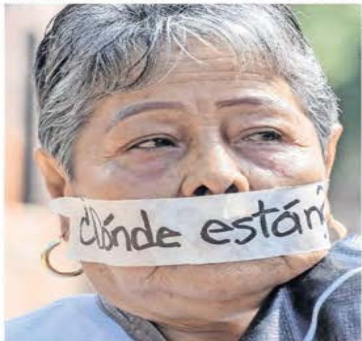
Zacatecas, Zac. — En medio del desfile por el 16 de septiembre, madres de desaparecidos reclamaron la indiferencia del gobernador, David Monreal, ante su lucha. | A4 |