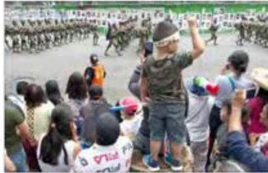
▲ Arriba a la izquierda, panorámica del Zócalo la noche del viernes. Ayer, el Colegio Militar fue el protagonista del desfile del 213 aniversario del inicio del movimiento de independencia, en el que