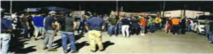
Miles de trabajadores que no han recibido salario mantienen plañtones en Altos Hornos.