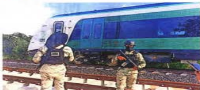
Militares custodiaron el vagón durante el tiempo que estuvo detenido. En tanto, funcionarios y directivos de empresas constructoras trataron de ayudar a que el tren retornara su curso.

Con AMLO a bordo, se descompone el Tren Maya