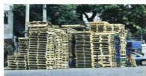
Las tarimas provocan complicaciones en la movilidad y, además, tienen un alto riesgo de incendio.