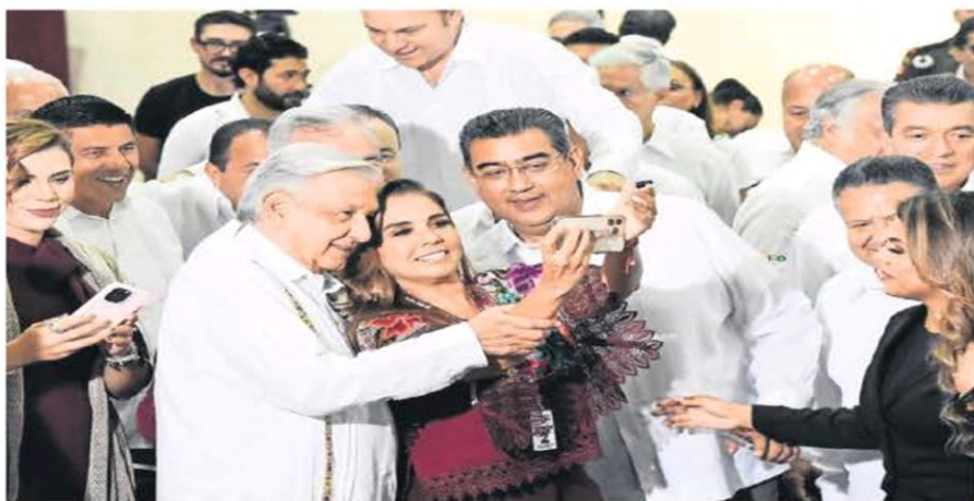
El presidente Andrés Manuel López Obrador rindió su Informe en Campeche, en el que destacó los avances en materias económica, energética y de planes sociales; al finalizar se tomó fotos con gobernadores que asistieron al evento.

Dice que su modelo de desarrollo es eficaz e insiste en reforma para limpiar al Poder Judicial