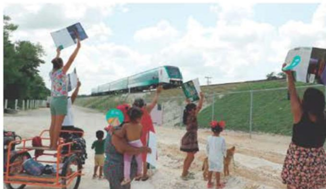
POBLADORES saludan el recorrido del Presidente en el llamado Jaguar Rodante, ayer.

FIJA entrega del Tren Insurgente, de Toluca, en septiembre 14; reactivación de Mexicana, en noviembre; reconoce apoyo de Sedena y Marina; va contra Poder Judicial. págs. 4 a 8