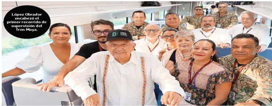
López Obrador encabezó el primer recorrido de supervisión del Tren Maya.

Por ello, recordó que enviará una iniciativa de reforma para que jueces, magistrados y ministros sean electos por voto directo y popular, y así limpiar al Poder Judicial “de complicidades, conflictos de interés, convivencias inconfesables, corrupción y derroche de recursos.”