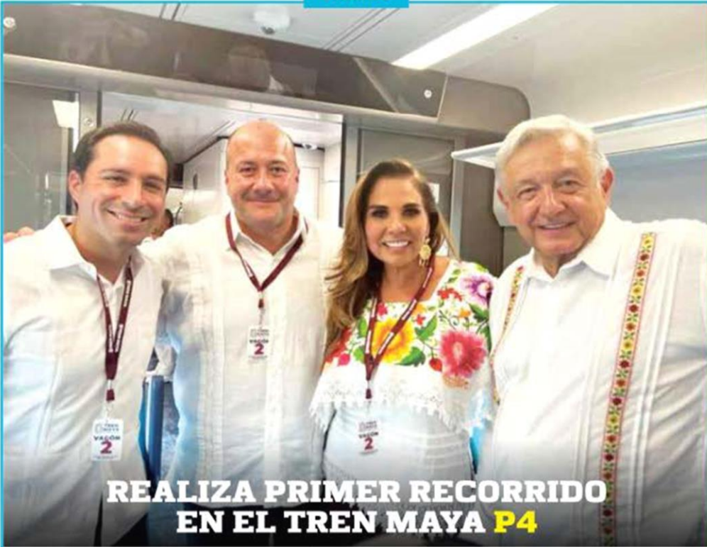
REALIZA PRIMER RECORRIDO EN EL TREN MAYA P4