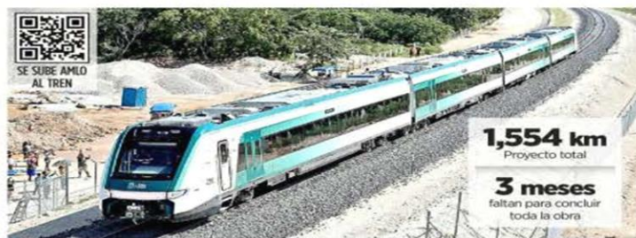
El tren tuvo ayer su primer recorrido, entre Campeche y Teya, Yucatán.

Y criticó el uso de la tribuna para la promoción de la hidalguesa. "Es legal lo que hicieron, pero completamente inmoral que vengan aquí a hacer un mitin de campaña en total fraude a la ley".