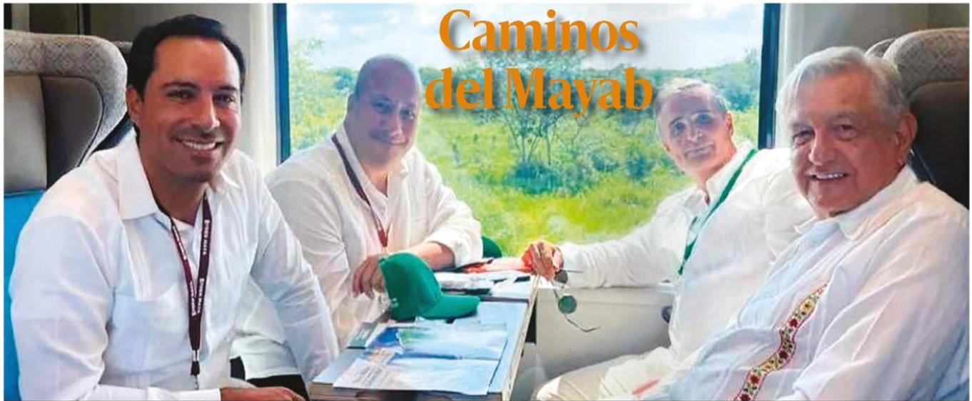
El presidente Andrés Manuel López Obrador inauguró el Tren Maya en un recorrido de reconocimiento entre Campeche y Mérida; estuvo acompañado por los gobernadores de Yucatán, Jalisco y Estado de México, Mauricio Vila (PAN), Enrique Alfaro (MC) y Alfredo del Mazo (PRI), respectivamente.