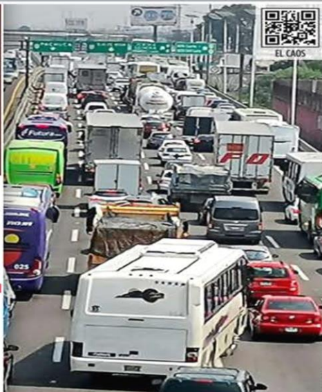
Los choferes acusan que han sido amenazados, golpeados, asaltados, extorsionados e, incluso, algunos han sido asesinados.