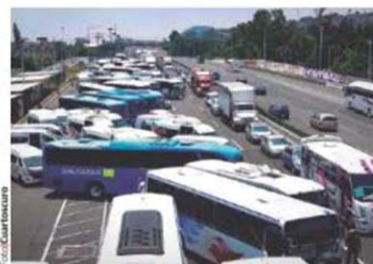
AUTOBUSES de Tizayuca, ayer, en el bloqueo.

BLOQUEAN desde las 5:00 horas la autopista; denuncian extorsiones e inseguridad; se forman filas de kilómetros; chocan con automovilistas y afectan a miles de pasajeros. pág. 12