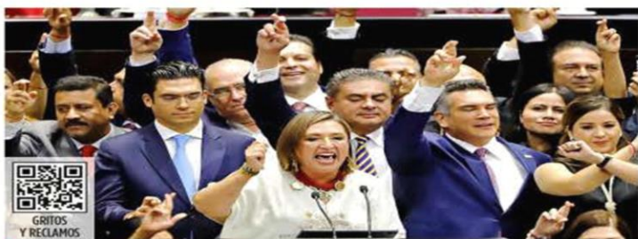
Legisladores del PAN, PRI y PRD respaldaron a Xóchitl Gálvez en la tribuna.