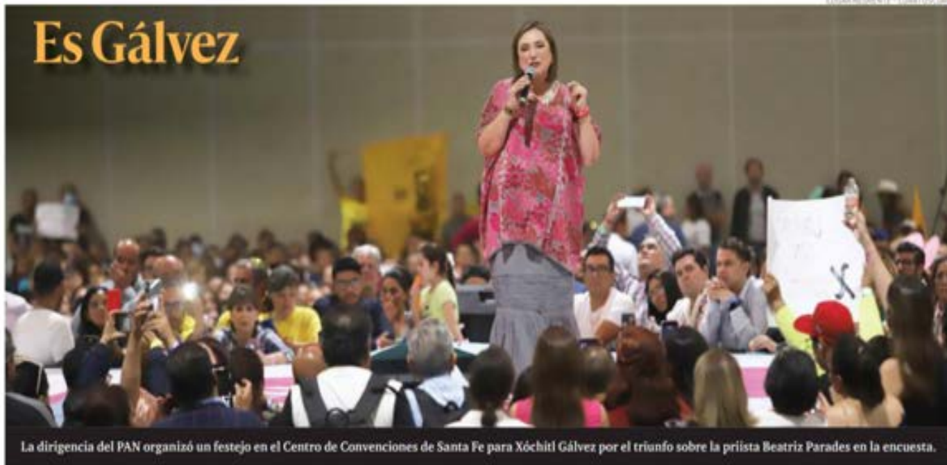
La dirigencia del PAN organizó un festejo en el Centro de Convenciones de Santa Fe para Xóchitl Gálvez por el triunfo sobre la priista Beatriz Paredes en la encuesta.