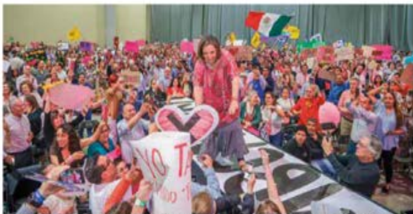
Encuesta. La senadora panista obtuvo 15 puntos de ventaja sobre Beatriz Paredes, quien a su vez reconoció los resultados.