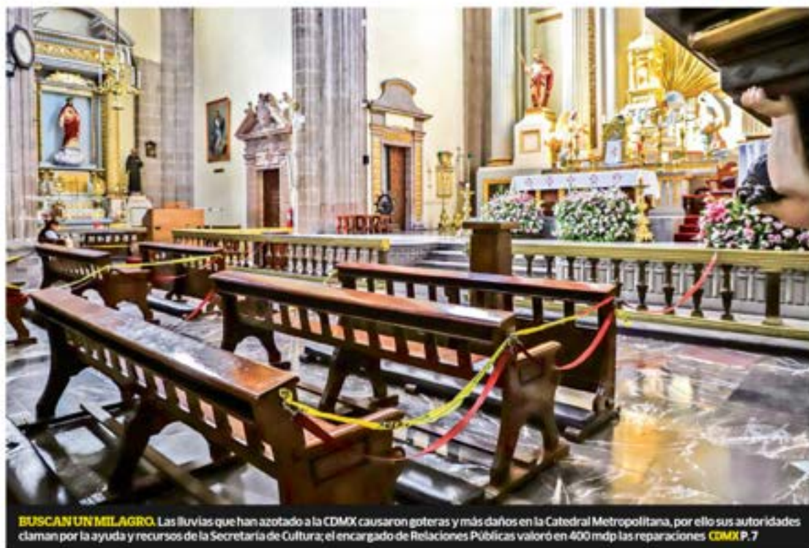
BUSCAN UN MILAGRO. Las lluvias que han azotado a la CDMX causaron goteras y más daños en la Catedral Metropolitana, por ello sus autoridades claman por la ayuda y recursos de la Secretaría de Cultura; el encargado de Relaciones Públicas valoró en 400 mdp las reparaciones COMX P. 7