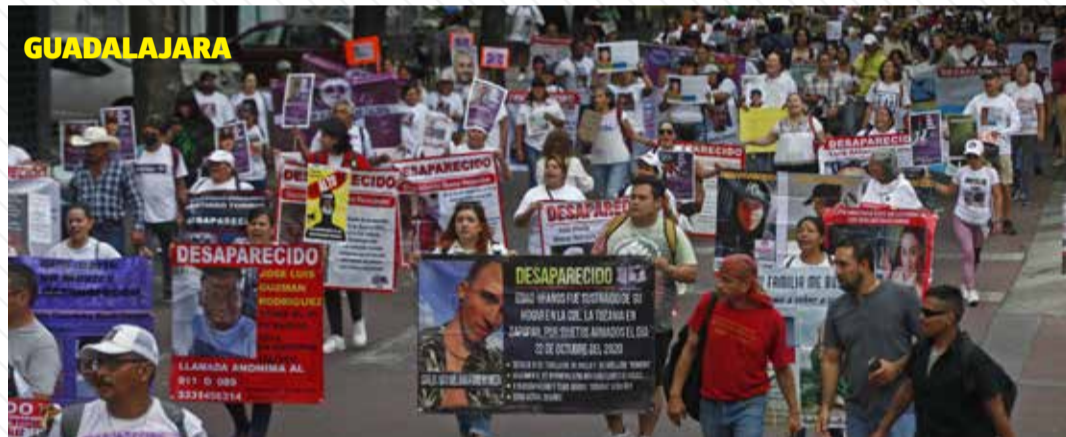
HASTA ENCONTRARLOS. Miles de personas en todo el país salieron a las calles este 30 de agosto para exigir a las autoridades acciones contundentes para buscar a las personas desaparecidas.

Con la consigna de que "para los priistas, la política siempre ha significado anteponer el interés superior de la nación por sobre todas las cosas", Alito Moreno anunció el respaldo de los 32 comités estatales del PRI y de toda la militancia a la candidatura única de Xóchitl Gálvez. Pág. 3