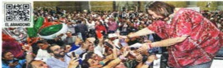
EL FESTEJO. La panista Xóchitl Gálvez celebró anoche su candidatura única ante cientos de simpatizantes.