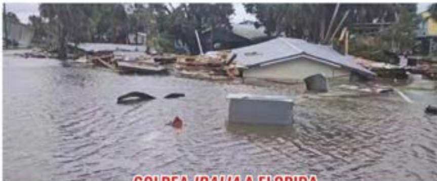
GOLPEA IDALIA A FLORIDA