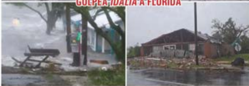
El huracán Idalia entró con toda su furia al oeste de la península de Florida, provocando grandes inundaciones y destrozos. En la noche se trasladó hacia Georgia. ▶ 19