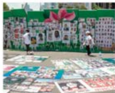
BUSCADORAS, ayer en la Glorieta del Ahuehuete.

EN CDMX colectivos ven riesgo en censo de desaparecidos; cifra es de 120 mil y la oficial dista de la realidad; dicen: exigen reunión con Encinas y Alcalde y ser tomados en cuenta. págs. 12 y 14