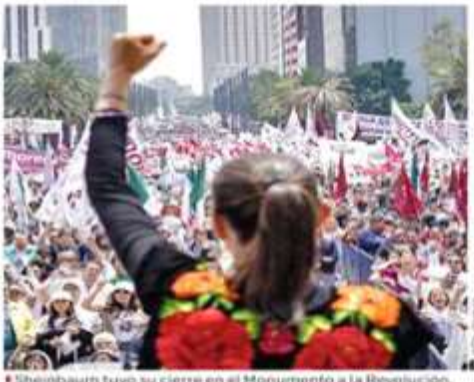
Sheinbaum tuvo su cierre en el Monumento a la Revolución.