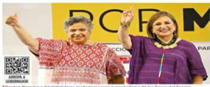
Beatriz Paredes y Xóchitl Gálvez protagonizaron ayer el último de los Foros del Frente.

Afirma que un sector de MC si desea hacer alianza con Frente opositor