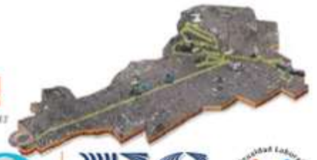
GRÁFICO: ARTURO RAMBET