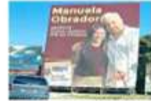
Uno de los espectáculos colocado en Tuxtla Gutiérrez.