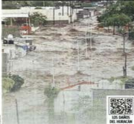
LOS DAÑOS DEL HURACÁN