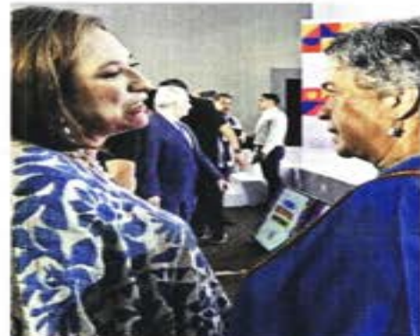
Xóchitl Gálvez, Beatriz Paredes y Santiago Creel realizaron en Monterrey el segundo foro del bloque opositor.

MONTERREY.- Los tres aspirantes presidenciales del Frente Amplio por México, integrado por el PAN, PRI y PRD, coincidieron ayer en Monterrey en la necesidad de impulsar la generación de energías limpias y revisar la operación de Pemex. En el segundo de cinco foros regionales previos a la definición del candidato, los panistas Santiago Creel y Xóchitl Gálvez, y la priista Beatriz Paredes expusieron en Cierres sus opiniones e ideas en relación con la superación de la pobreza, crecimiento económico y sustentabilidad. No hubo confrontaciones entre los expositores, sino un ambiente de respeto mutuo. Las críticas que sí se dieron fueron especialmente para las políticas del Presidente Andrés Manuel López Obrador que favorecen los combustibles fósiles, frenando alternativas más económicas y de menor impacto ambiental. En sus participaciones, los tres aspirantes hicieron mención a la contaminación de la Refinería de Cadereyta y cuestionaron duramente a Pemex. Creel se lanzó contra las políticas de AMLO y dijo que es necesario revisar a Pemex. "Pemex está quebrado", sostuvo el panista. "Va bajando su nivel de credibilidad y lo primero que tenemos que hacer es un estudio de costo-beneficio".