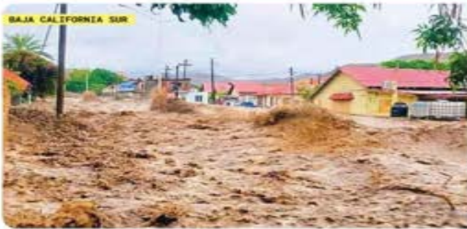
BAJA CALIFORNIA SUR