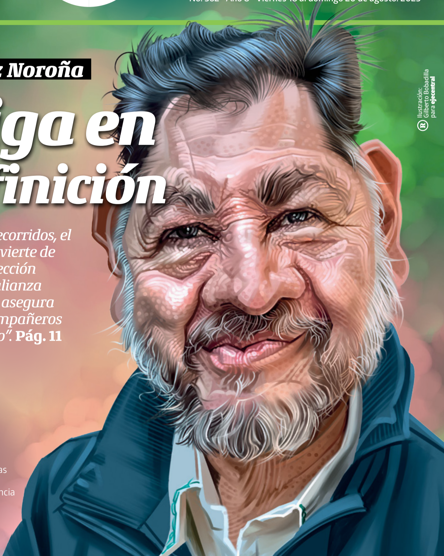
Ilustración: Gilberto Bobacilla para eje@central

›Fallar, por muy humano que sea, puede conducir a verdaderas tragedias si sucede en campos como la medicina, pero la evidencia muestra que la gran mayoría es evitable. Pág. 17