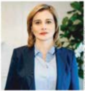
MARU CAMPOS - EL SAO DE PUEBLA

Maru Campos, gobernadora de Chihuahua, pide a la gente reciclar libros de texto NACIONAL