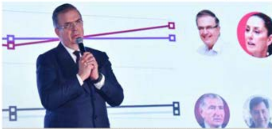
Tras haber marchado siempre en segundo lugar abajo de Claudia Sheinbaum, Marcelo Ebrard amenaza con romper con Morena si no cumplen con sus exigencias sucesorias.