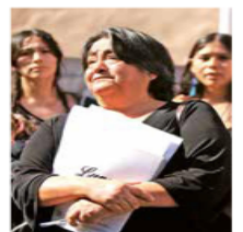
Yolanda es mamá de Dulce, víctima de violencia vicaria.

Una abuela denunció que las autoridades dieron la custodia de su nieto a la familia paterna, aunque el padre está preso por el asesinato de su otro hijo. / 14