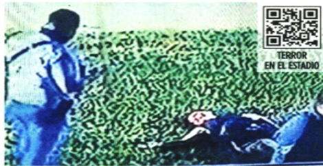
La mujer quedó tendida en el césped de la cancha.