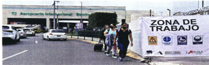
Los trabajos en la Terminal 2 del aeropuerto capitalino ya están en marcha.

El Presidente Andrés Manuel López Obrador