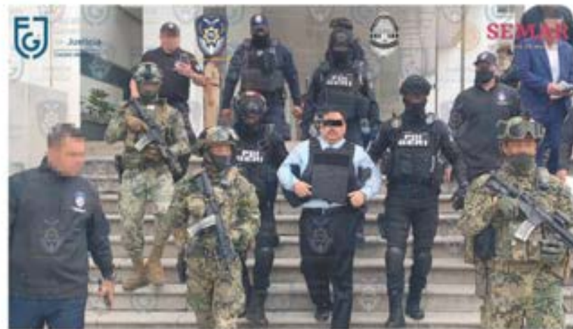
TRASLADO del fiscal de Morelos en un operativo realizado por la Fiscalía General de Justicia de la CDMX y la Marina, ayer.

GOBIERNO anuncia revisión pública en conferencias vespertinas para aclarar contenidos; SNTe los defiende, sin ser acritico, señala.