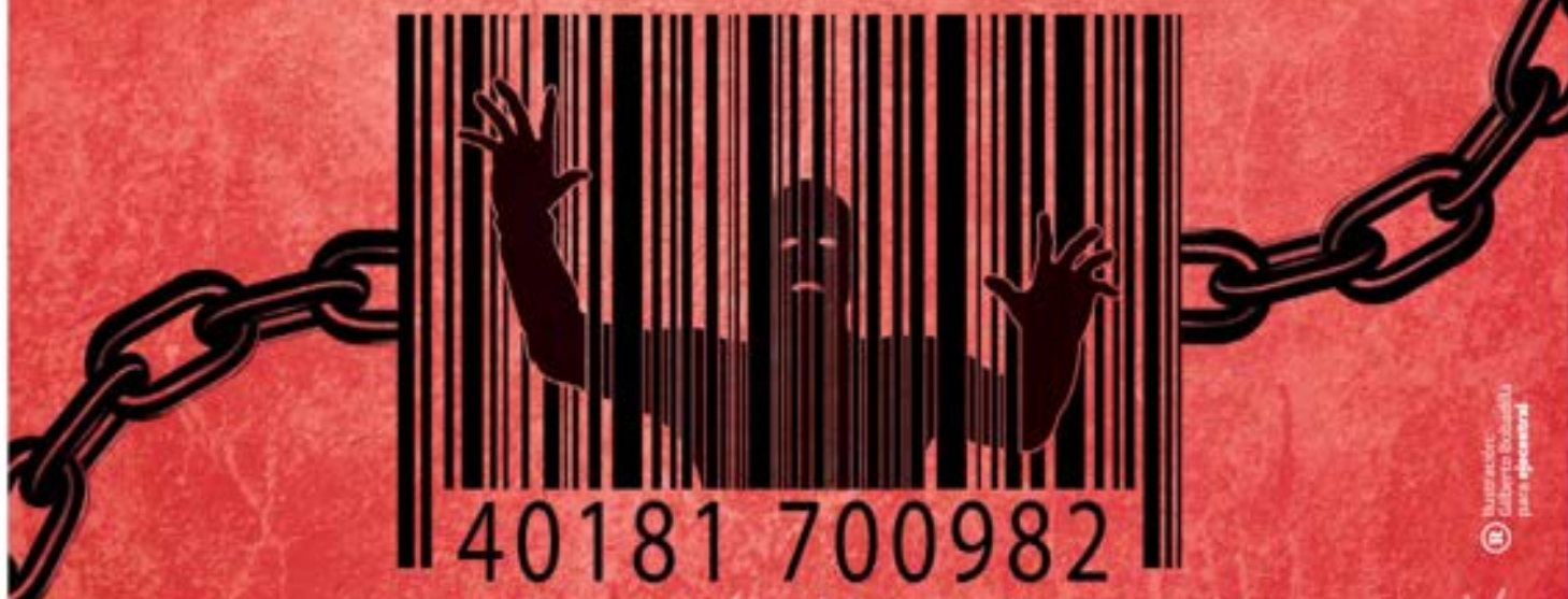
Ilustración: Gobierno Electoral para el desarrollo

El matrimonio y el trabajo forzado, entre otras formas de explotación, se esconden detrás de la desaparición de personas, algo que empoderará a los cárteles mexicanos. Pág. 11