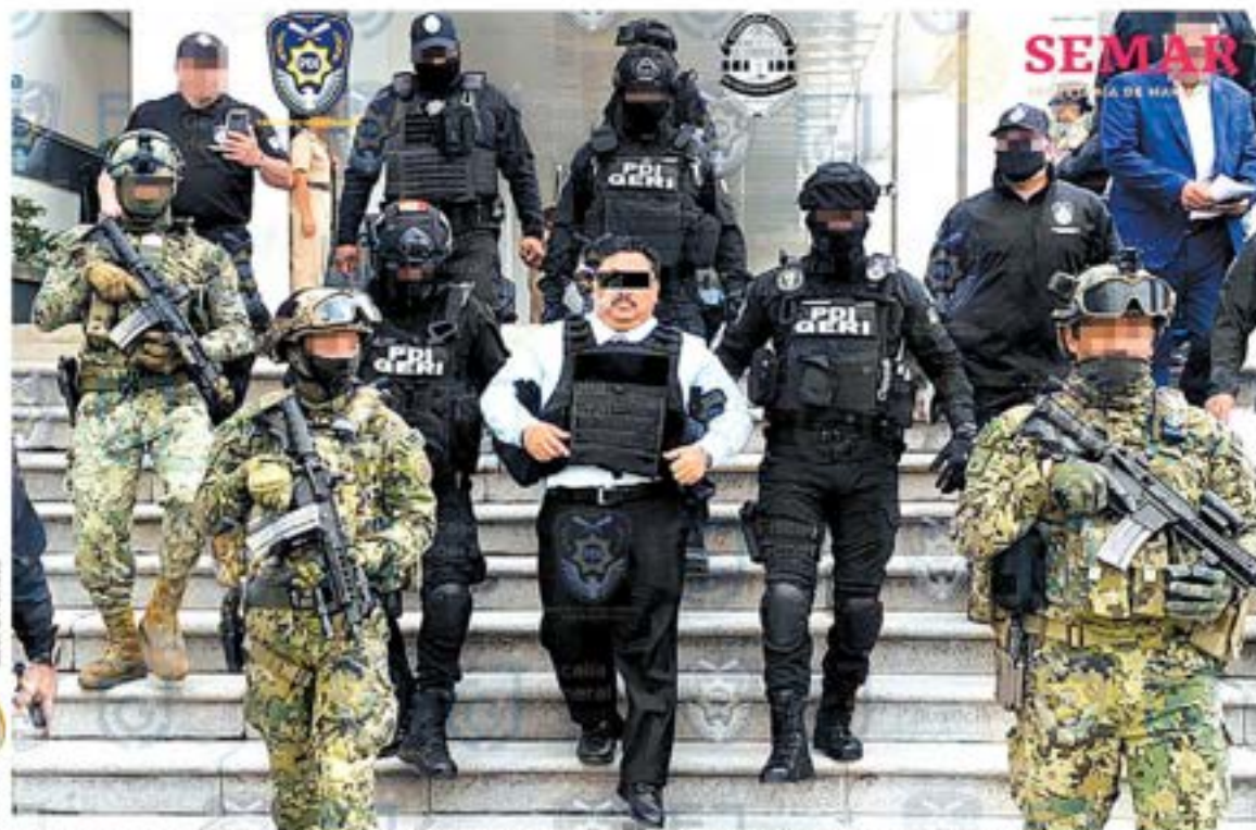
El titular del MP morelense está implicado en "retardo de la justicia" en el caso del feminicidio de Ariadna Fernanda. ESPECIAL

Arturo Pérez-Reverte Una reforma entre Lutero y Calvino p. 27