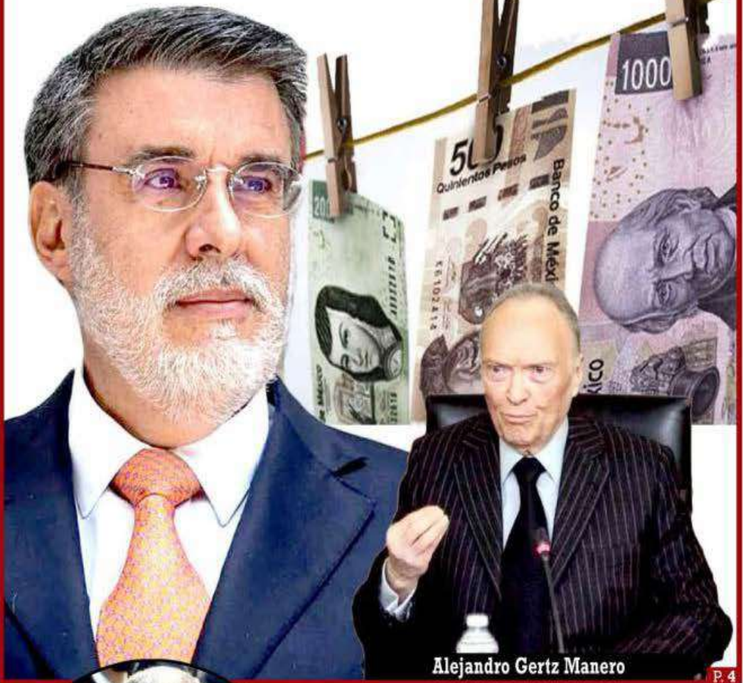
Alejandro Gertz Manero