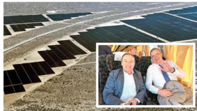
Encabezados por el canciller Marcelo Ebrard y el gobernador Alfonso Durazo, representantes de más de 65 países conocieron las obras de la Central Fotovoltaica de Puerto Peñasco, en Sonora.