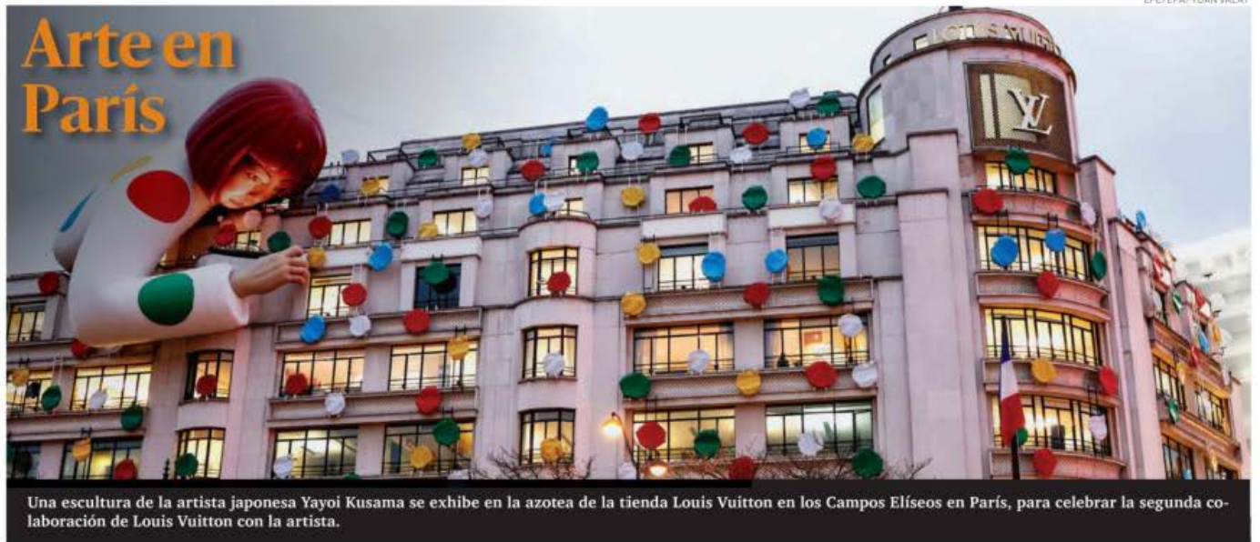
Una escultura de la artista japonesa Yayoi Kusama se exhibe en la azotea de la tienda Louis Vuitton en los Campos Elíseos en París, para celebrar la segunda colaboración de Louis Vuitton con la artista.