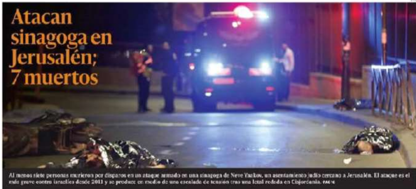
Al menos siete personas murieron por disparos en un ataque armado en una sinagoga de Neve Yaakov, un asentamiento judío cercano a Jerusalén. El ataque es el más grave contra israelíes desde 2011 y se produce en medio de una escalada de tensión tras una fatal redada en Cisjordania. PÁG. 4